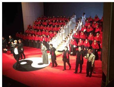
Aplauze la final