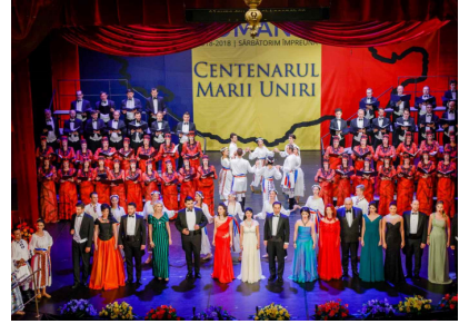
Final cu Hora Unirii