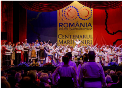
Dans (baletul Operei ieșene)