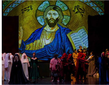
Scenă act doi, al doilea tablou