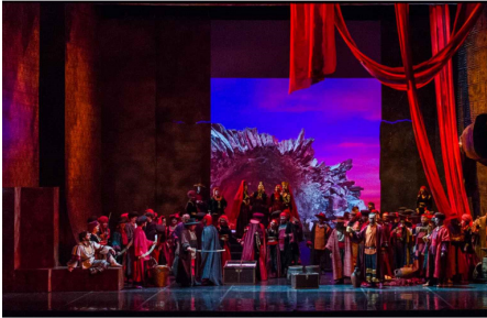
Scenă act doi, primul tablou