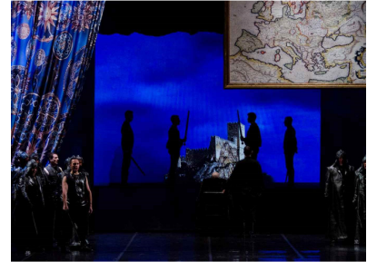
Scenă act trei, primul tablou