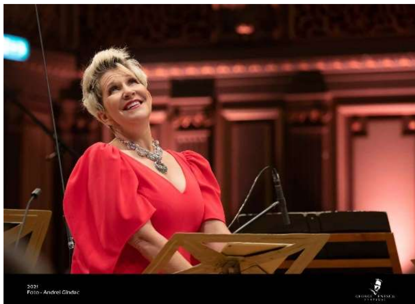
Joyce DidoDonato

A intrat în scenă plutind, distinsă, delicată, într-o rochie corail . (Avea s-o schimbe în partea secundă cu una de un auriu strălucitor, și ea subliniindu-i silueta impecabilă.) Mi-a evocat apariția pe scena Ateneului a legendarei Elisabeth Schwarzkopf acum multe zeci de ani, în văluri, parcă planând. Aceași eleganță, aceeași noblete, același farmec. S-o vezi pe Joyce pe podiumul de concert este o bucurie, o fascinație, să-i urmărești mersul princiar ca pe un catwalk și privirile blânde aruncate spectatorilor, acompaniatorilor, gesturile chiar cochete ce fac să pară că muzica îi izvorăște din ființă și trup, în definitiv, să-i asculți cântul fermecat... Iată desfătările unei după-amiezi de excepție în festivalul enescian.