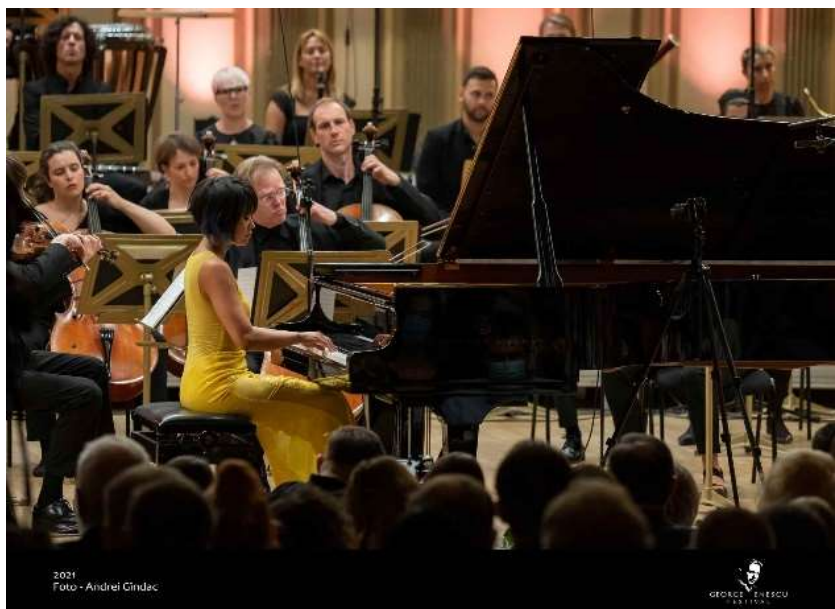
Yuja Wang

Concertul nr.2 în Fa major pentru pian și orchestră op. 102 de Șostakovici a fost un nou prilej pentru demonstrația de bravură a pianistei, care însă trebuia ghicită printre sonoritățile excesive ale milităroasei orchestre (prima mișcare, Allegro). Au venit însă părțile următoare, legate, în care mai întâi elegia a dominat spațiile (Andante), iar apoi agilități și avalanșe de forță s-au îmbinat cu echilibrate sonorități orchestrale, finalizate electrizant, strivitor, covârșitor.