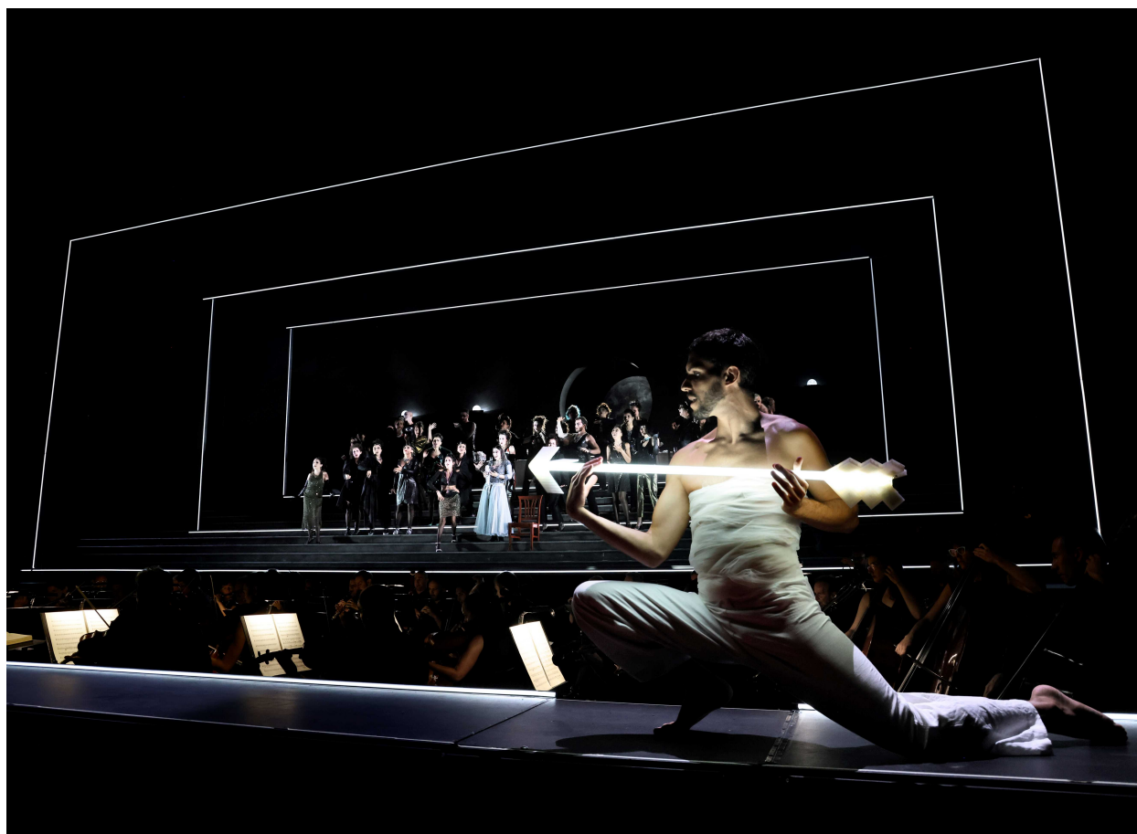
Scenă de ansamblu.

Producția a fost semnată de regizorul Johannes Erath, acompaniat de scenografa Heike Scheele, de designerul costumelor Jorge Jara, de Bibi Abel (video) și Fabio Antoci (lumini). O echipă care a împărțit bine scena uriașă de la Vitrifrigo Arena, folosind pentru proiecții nu numai fundalul ci și lateralele dinspre arlechine. Cadre iluminate ca niște rame de tablouri au fost utile în succedarea sau suprapunerea planurilor, puține obiecte de decor, totul modern, au ocupat spațiul. Costumele pot fi apreciate drept atemporale, totuși cu o undă de patină veche. Un Eros cu arc din neon a fost prezent mai tot timpul pe platou și a țintit perechile îndrăgostite, el însuși rămânând imobil în momentele critice, când chiar săgețile îi erau furate simbolic de eroi. În orice caz, montarea a lăsat cântăreții să se desfășoare, ceea ce era absolut necesar, ținând cont de complicațiile partiturii.