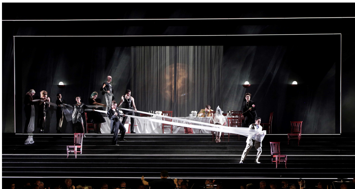
Scenă de ansamblu.

Iată încă o nouă producție propusă de Rossini Opera Festival 2024, jucată la Vitrifrigo Arena din suburbiile orașului, la care spectatorii pot ajunge cu navete de autobuz din diverse zone centrale.