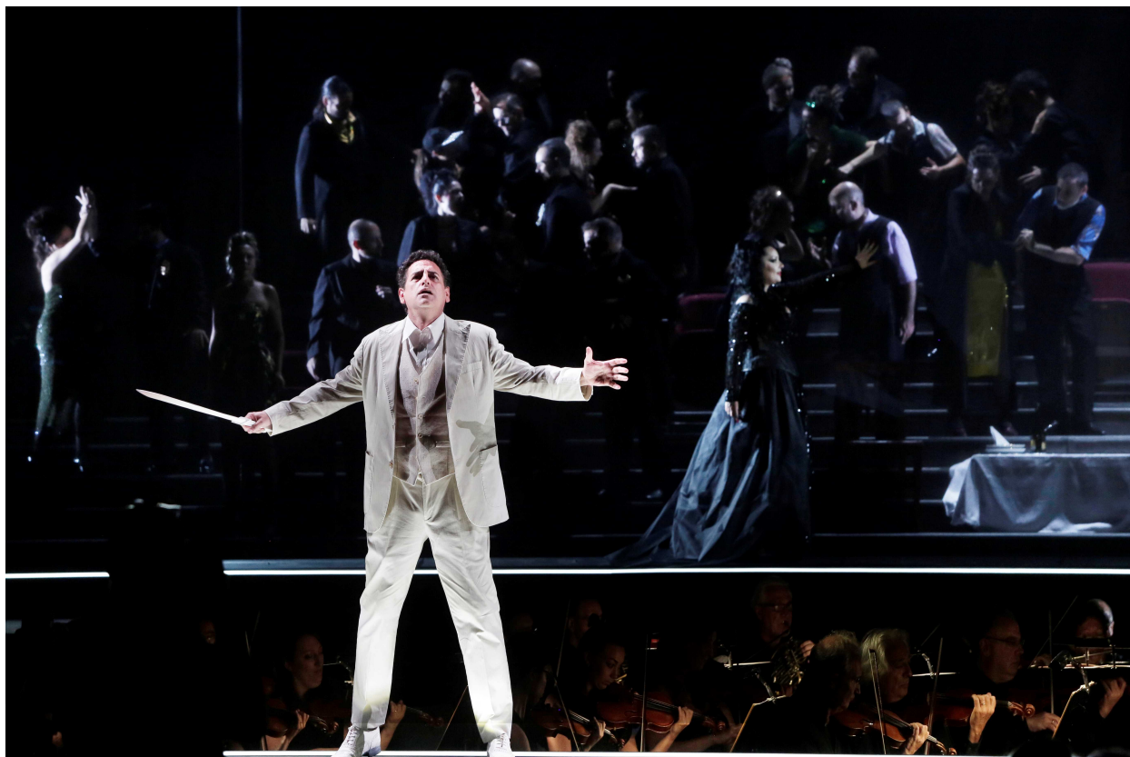
Juan Diego Flórez.

Juan Diego Flórez rămâne un rossinian desăvârșit. Cavatina lui Oreste „Reggia abborrita!”, duettino cu Ermione „Amarti?”, intervențiile din marea scenă a Ermionei sau din final au demonstrat-o.