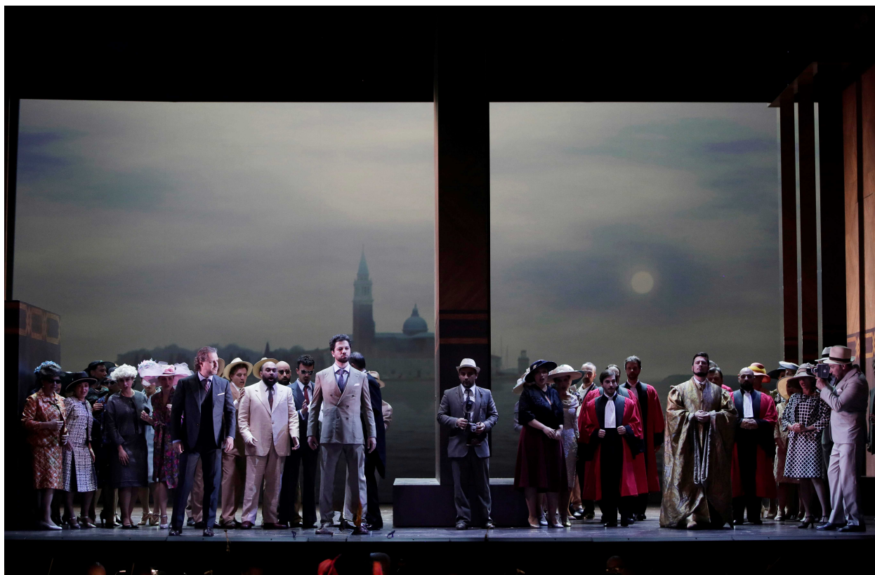
Scenă din „Bianca și Falliero”.