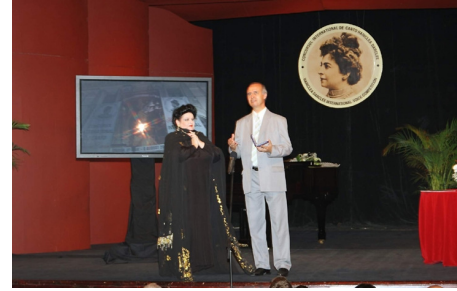
Decernarea monedei Darclée primarului Brăilei