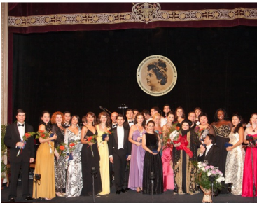
Laureații ediției din 2010

12 români din 29, un procent de peste 40%, bun pentru țara noastră, care își arată potențialul și cu acest prilej!