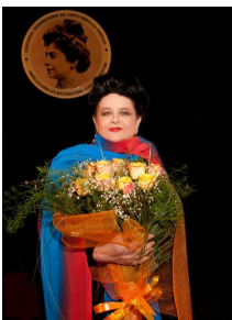
Soprana Mariana NICOLESCO

De 15 ani, la Brăila, în țară și pe mapamond, cele două nume de celebre soprane, Hariclea Darclée și Mariana Nicolesco, s-au asociat și se confundă în teritoriul unui mare concurs internațional de canto, care a devenit centrul vital al manifestărilor consacrate omagierii memoriei Haricleei Darclée. În jurul lui, fondatoarea Mariana Nicolesco a conceput un festival și, în ani alternativi, cursuri de măiestrie vocală. Totul pe parcursul a două săptămâni, la cumpăna lunilor iulie-august, perioadă în care municipiul de la Dunăre se transformă în nucleul de operă al României și al acestei părți de Europa, cu binomul Darclée – Nicolesco devenit simbol.