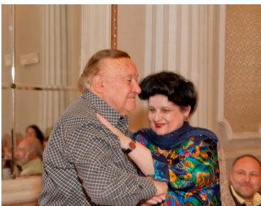
Nicolae Herlea și Mariana Nicolesco