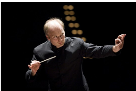
dirijorul Gianandrea Noseda