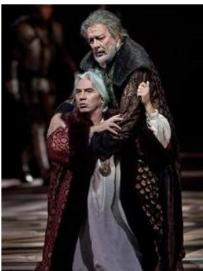
Dmitri Hvorostovski și Ferruccio Furlanetto

orchestral al ariei „Il lacerato spirito” din „Simon Boccanegra”, sobru și trist, în contradicție cu tălmăcirea lacrimogenă propusă de sexagenarul bas Ferruccio Furlanetto (Fiesco), deloc profetic, deloc sepulcral. Remarc în același opus transparența instrumentiștilor în preludiul la primul act, veritabilă nocturnă simfonică sub clar de lună, confesiune singuratică a Ameliei către nemărginirea mării, „Come in quest’ora bruna”, o arie în care Barbara Frittoli și-a expus știința de cânt în teritoriul verdian, chiar când vibrato-ul vocii devine larg. Și dacă vocalizele în piano ale mării scene a Consiliului dogal nu i-au plutit, finalul în pianissimo al ansamblului concertato de la finele actului prim a fost frumos iar fraza „... sovra entrambi cada la scure del carnefice...” din actul al doilea s-a transformat într-o pildă de abordare sopranilă liric-spintă (sunt două octave descendente, arpeggiate, de la Si bemolul acut atacat în forță până la cel de sub portativ, negociat cu voce în sonorități impresionante „di petto”).