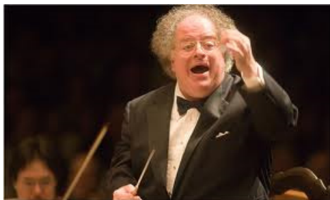
dirijorul James Levine