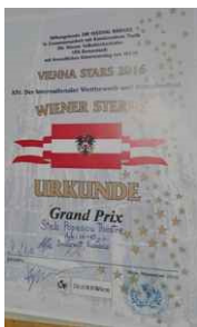
Grand Prix Vienna