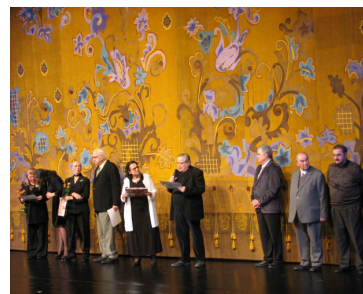
Premianți ai FMR