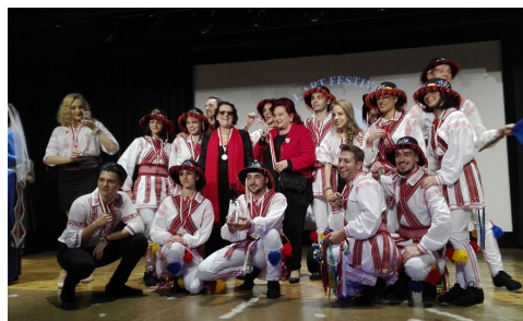
Trupa TSP la Viena