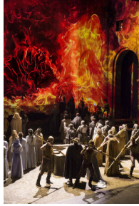
Finalul operei