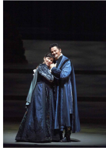
Krassimira STOYANOVA și Piotr BECZALA,)