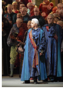
Dimitri HVOROSTOVSKY