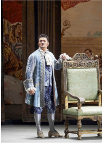
Piotr BECZALA

Tenorul Piotr Beczala a oferit o construcție minuțioasă a rolului regelui Gustaf al III-lea, pornită de la lirismul unui glas plăcut timbrat. Barcarola „Di’ tu se fedele” a avut brilianță, „slancio”, dar și mister în strofa a doua, cu frumoase „mezzevoci”. În cvintetul „È scherzo od è follia” a cântat cu flexibilitate, cu mobilitate în voce, depășind astfel marile provocări ale partiturii, țesăturile volatile. Exuberant și expresiv îndrăgostit în marele duet cu Amelia, a acuzat lipsa de impetuozitate spintă în unele pasaje („estinto tutto, sia fuorchè l’amor”). Emoționant a interpretat recitativul „Forse la soglia attinse” și aria „Ma se m’è forza perderti”, iar în expansiva tiradă „Sì, rivederti Amelia”, ce a încheiat scena, a adăugat de la sine o notă de Do natural, tocmai pentru sporirea spectaculozității extremului registru acut, câteodată ușor lejer.