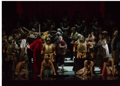
Scenă de ansamblu