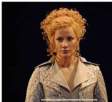
Dorabella în „Cosi fan tutte” la Zürich