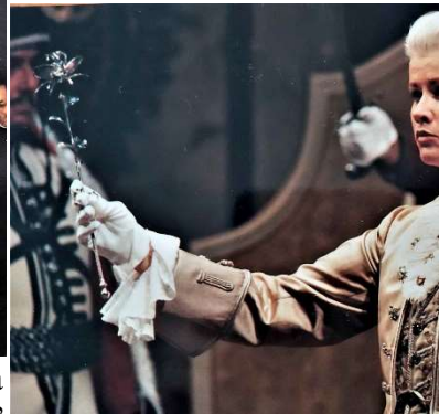
Octavian la Opera de Stat din Viena