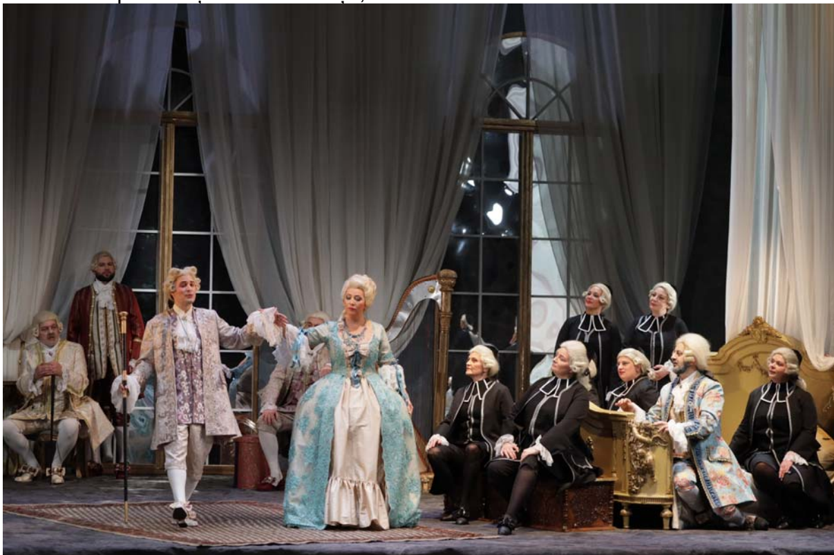
Scenă din „Manon Lescaut”

La Opera Naţională Bucureşti, evenimentul BOF '23 continuă.