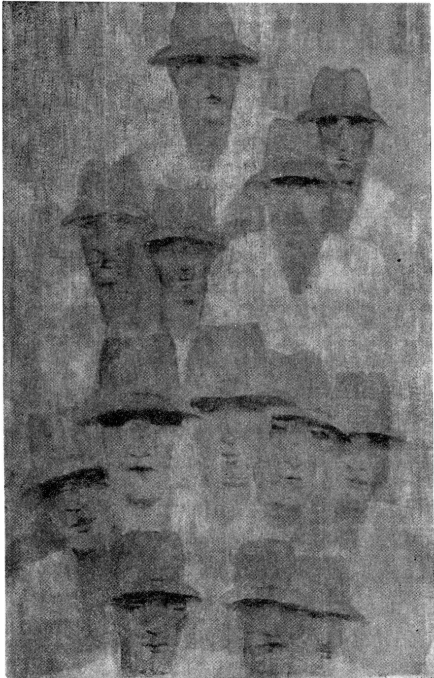
Fig. 3. „Vara” (Colecția Secției de artă a Muzeului județean Brașov).