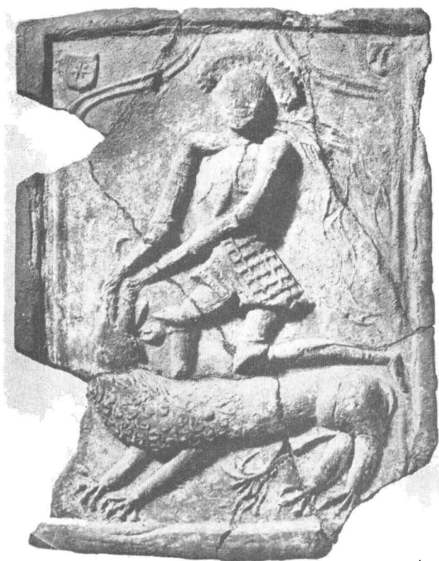
Fig. 6. Lupta lui Samson cu leul