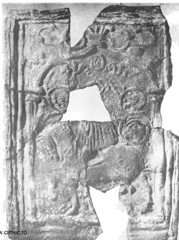
Fig. 4. Călăreț (Sf. Gheorghe ?)