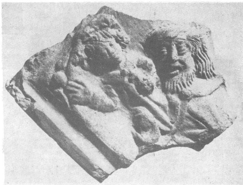
Fig. 14. Fragment cu Christoforus din colecția veche a Muzeului Brukenthal.