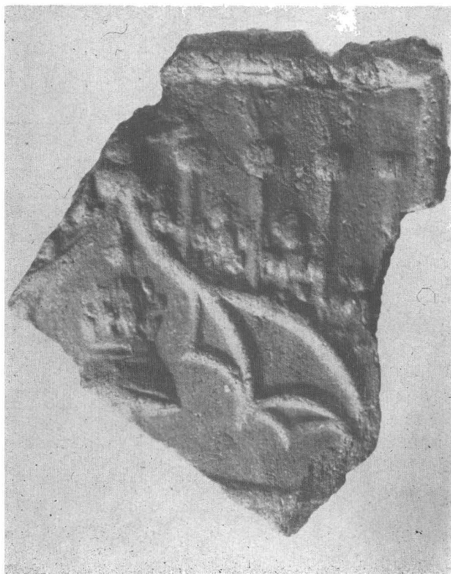
Fig. 15. Fragment cu portal gotic târziu din colecția veche a Muzeului Brukenthal.