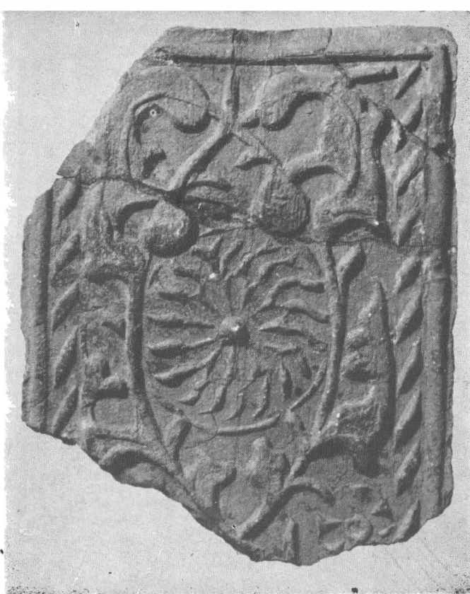
Fig. 5. Motiv vegetal stilizat