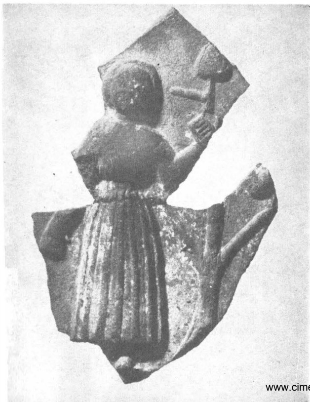
Fig. 10. Personaj feminin (Eva ?)