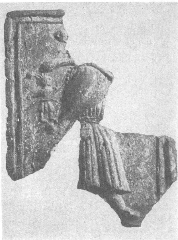
Fig. 11. Scenă cu două personaje (bufoni ?)