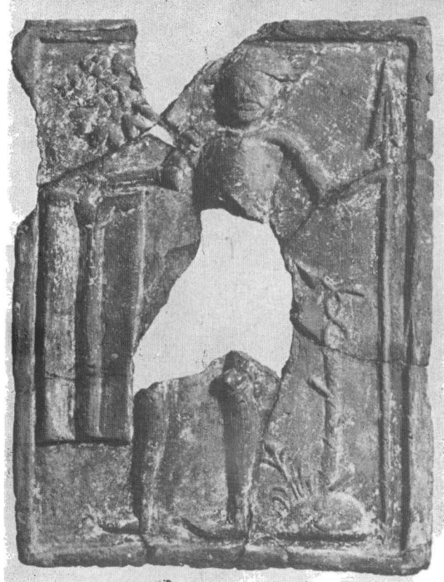
Fig. 3. Cavaler înarmat