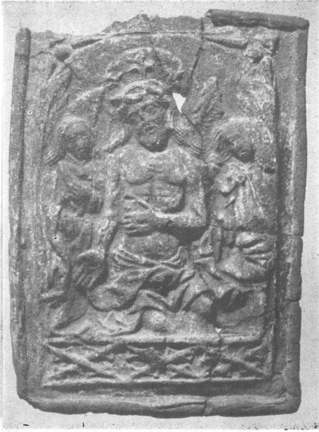
Fig. 7. Plingerea lui Christos