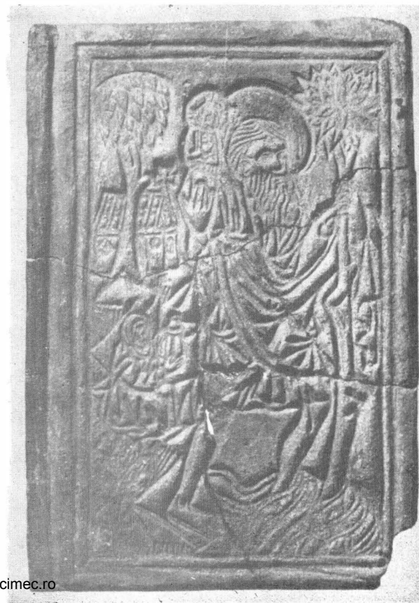
Fig. 8. Christoforus