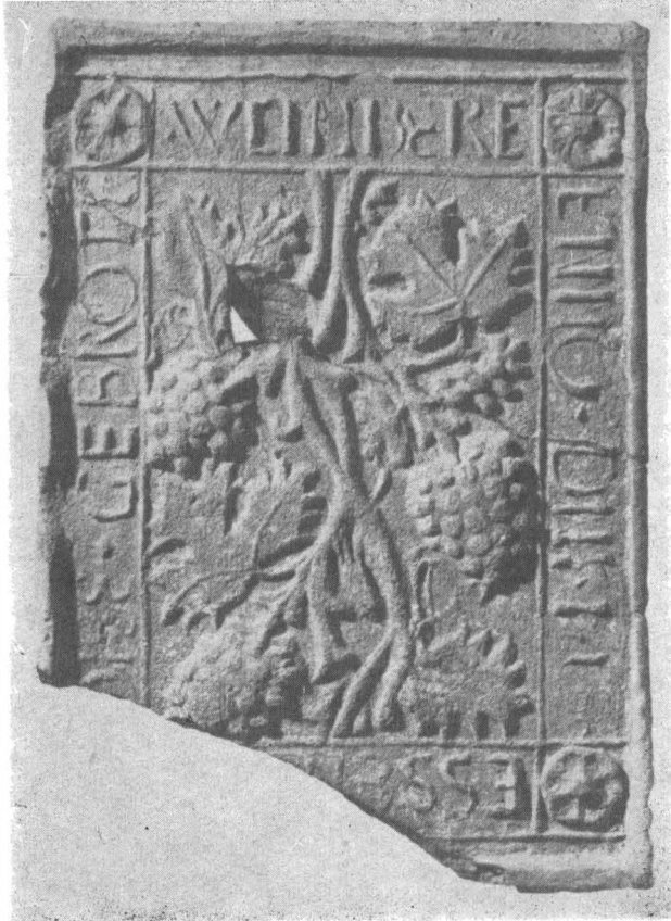
Fig. 9. Motiv vegetal