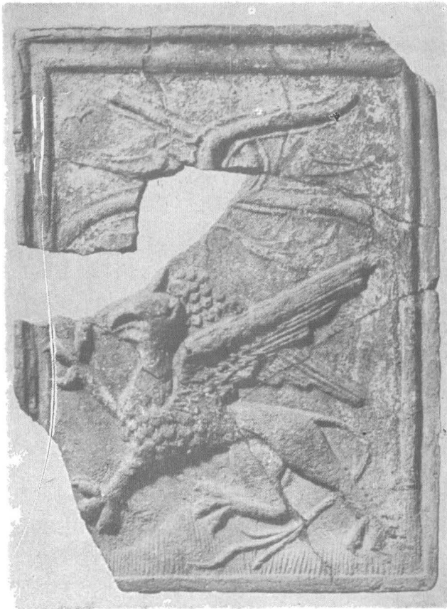
Fig. 1. Grifon