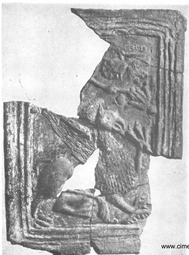
Fig. 2. Grifon