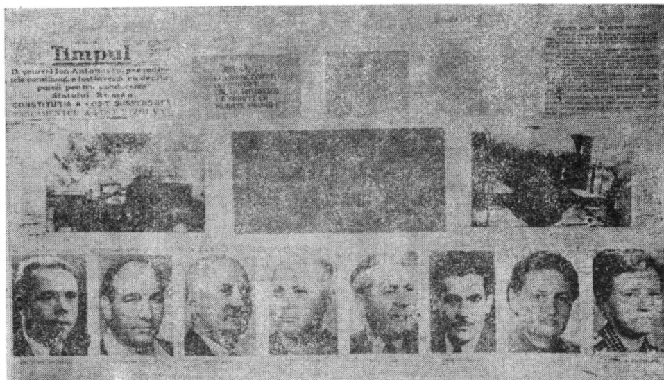
Fig. 3. Aspect din cuprinsul expoziției „50 de ani de lupte și biruinți” — panoul închinat luptei antifasciste.