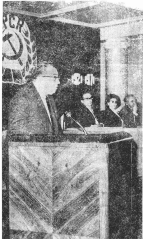
Fig. 6. Aspect din timpul desfășurării sesiunii științifice jubiliare.