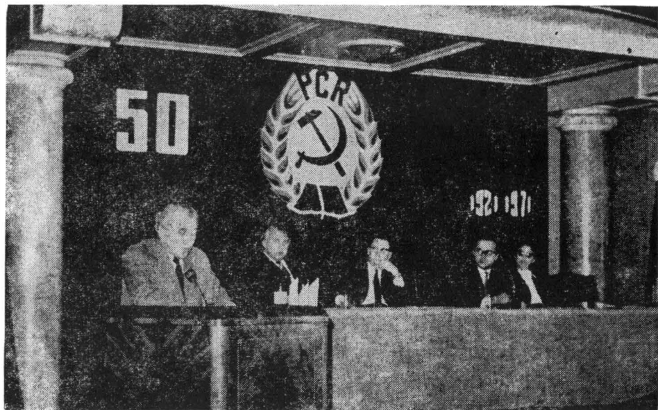
Fig. 5. Aspect din timpul desfășurării sesiunii științifice jubiliare.