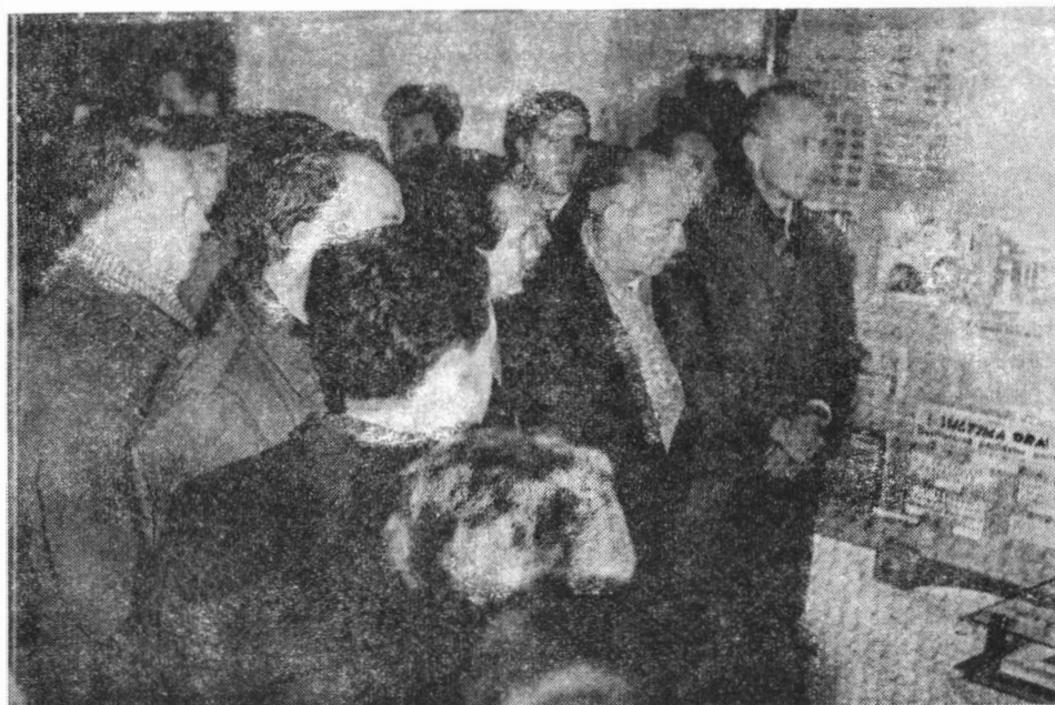
Fig. 7. Grup de cursanți de la învățământul de partid vizitează expoziția Muzeului de istorie, închinată mișcării muncitorești (1921—1944).