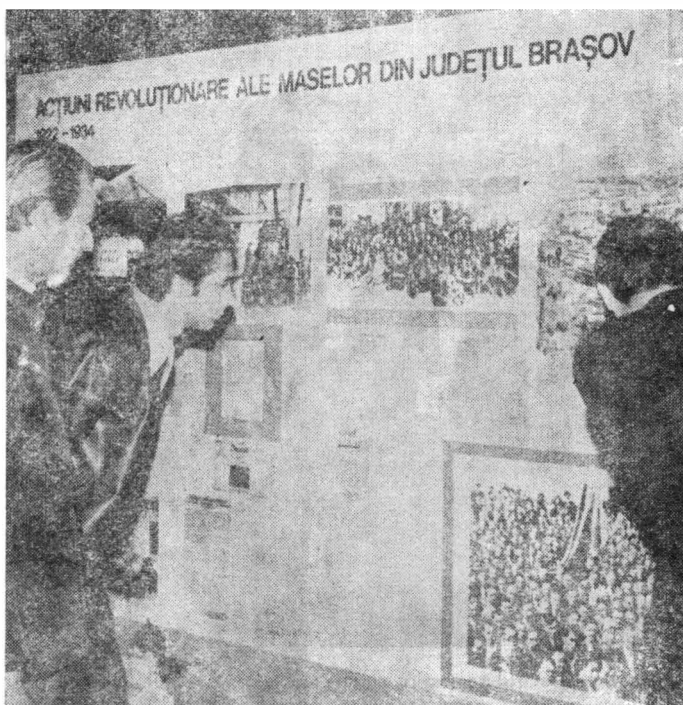
Fig. 2. Grup de vizitatori în fața panourilor expoziției „50 de ani de lupte și biruinți”, ce evocă lupta clasei muncitoare din județul Brașov, sub conducerea comuniștilor în anii 1922--1934.