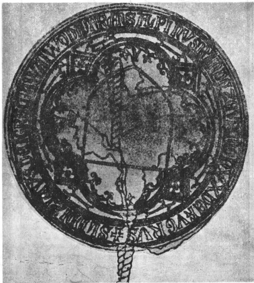
Fig. 2 Sigiliul reconstituit al lui Vladislav Vlaicu (După 1. Virtosu, Note și discuții sigilografice , în Studii și cercetări de numismatică III, Buc., 1960, p. 524).