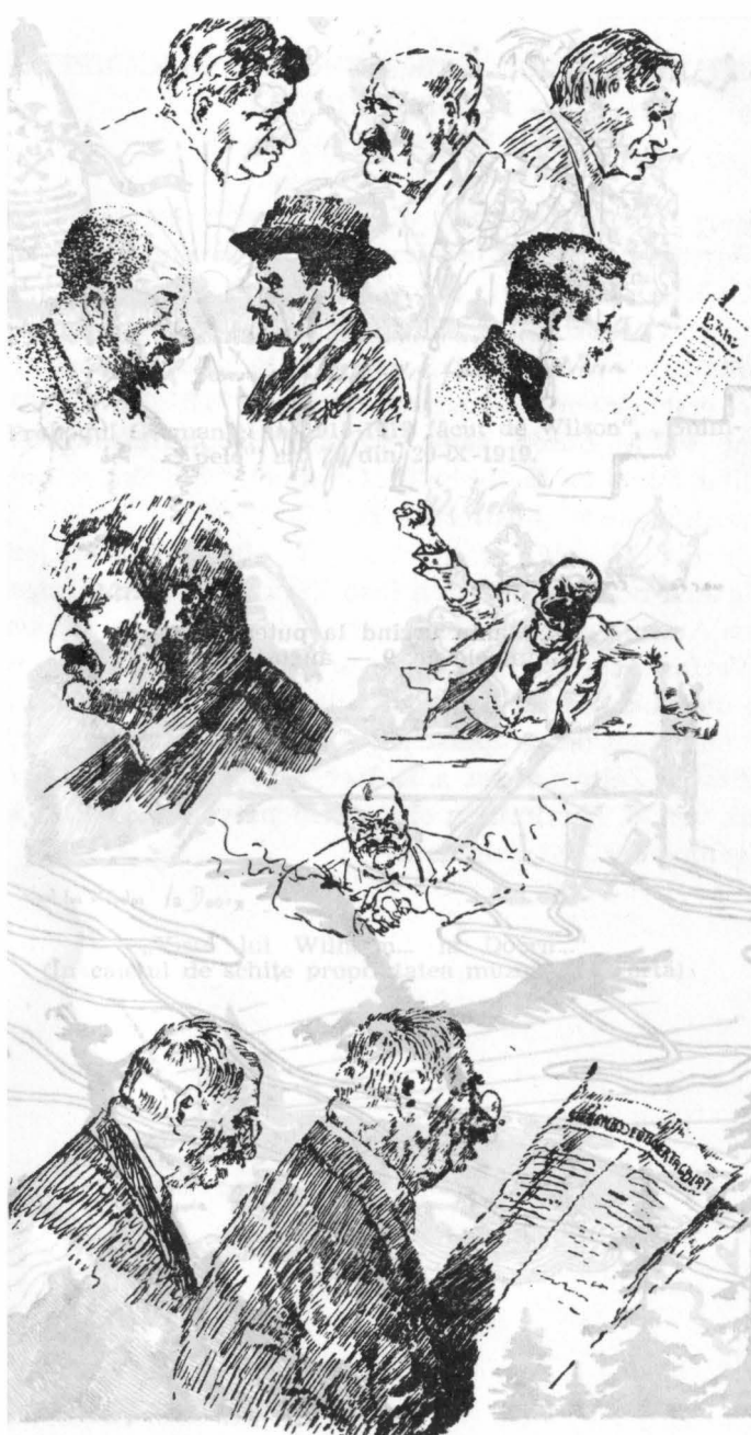
Capete de expresie (În caietul de schițe proprietatea muzeului de artă)