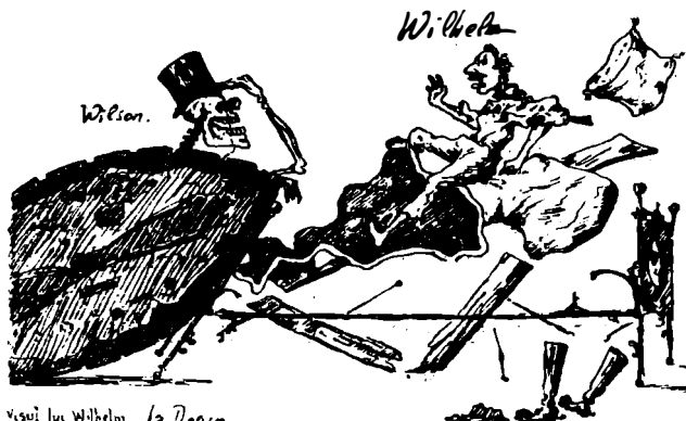
Visul lui Wilhelm la Doorn

„Prohodul Germaniei în 1918-1919 făcut de Wilson“, „Ghimpele“ nr. 11 din 20-X-1919.