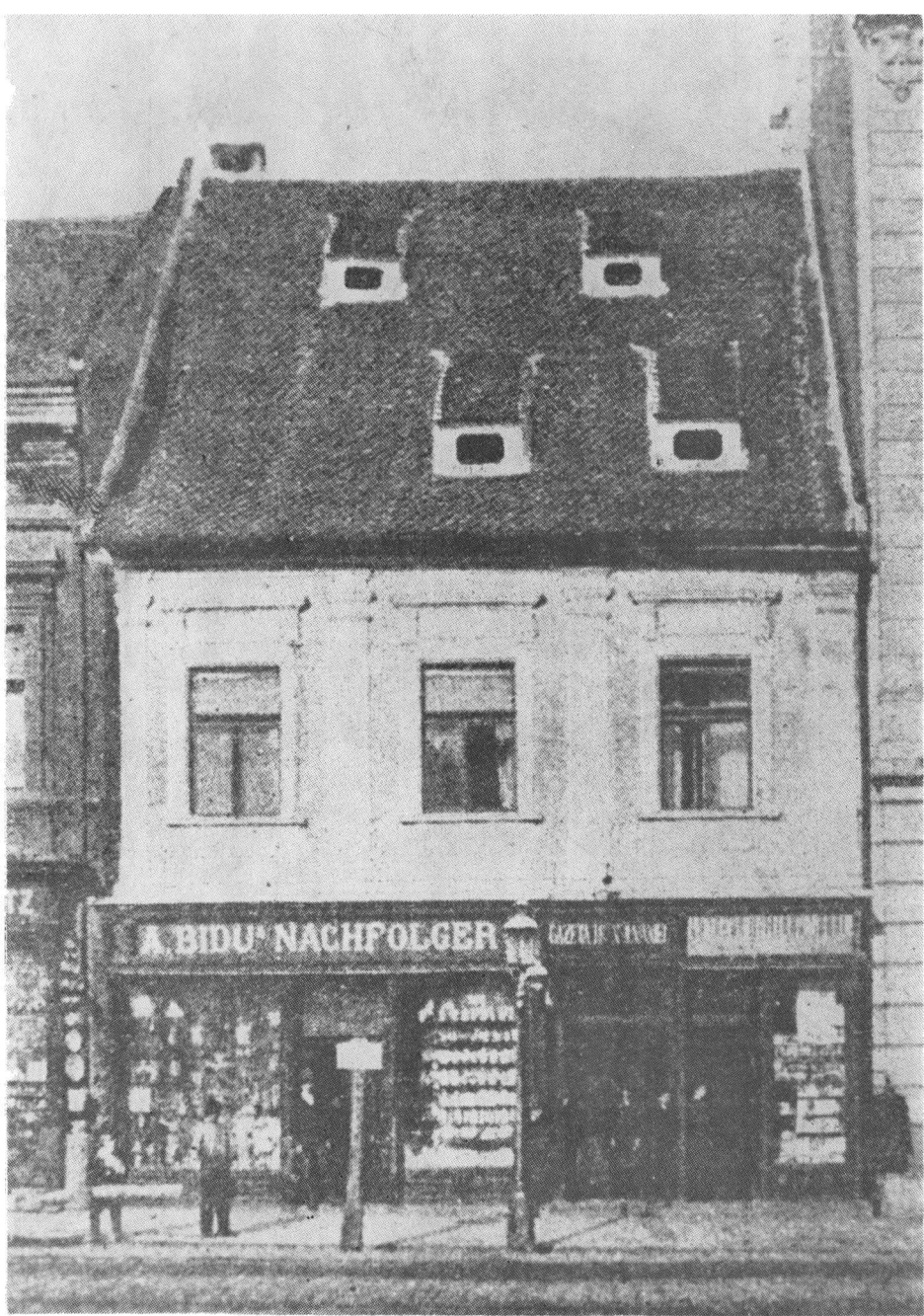
Sediul redacției Gazetei Transilvaniei, azi muzeul „Casa Mureșenilor“.