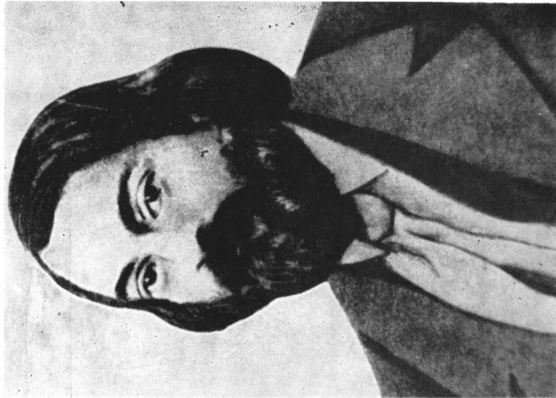
C. A. Rosetti (1816—1885)