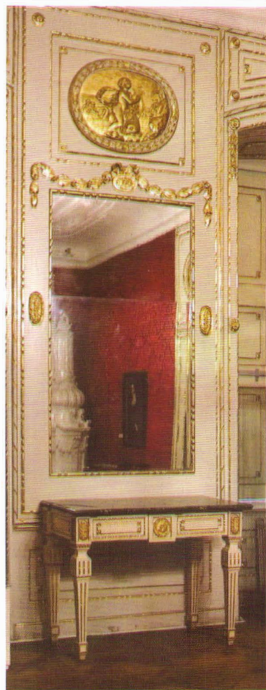
Fig. 6 Masă consolă , stil neo-clasic, atelier sibian, meşterul Johann Bauernfeind, anii 1780.