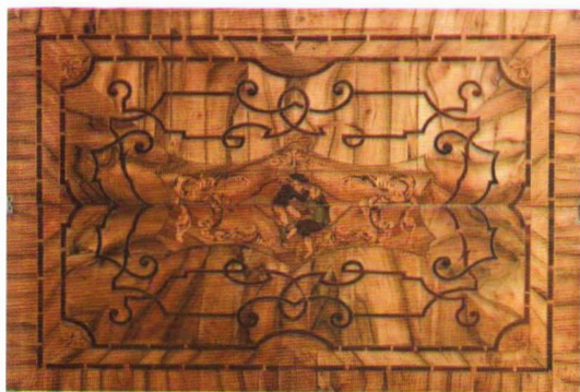
Fig. 4 Măsuță de joc , stil rococo, atelier sibian ?/ atelier vienez ? cca. 1770.