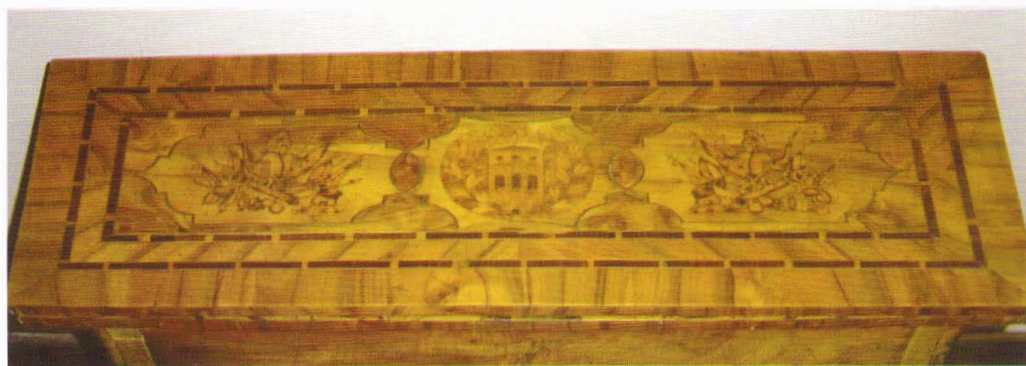
Fig. 7 Măsuță de salon , stil rococo, atelier sibian?, cca. 1770, central intarsiată stema familiei Brukenthal.