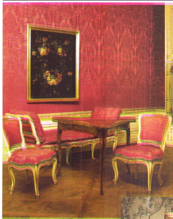
Fig. 2 Garnitură de salon, stil rococo, atelier sibian, meșterul L.C. Hezel, anii 1780.