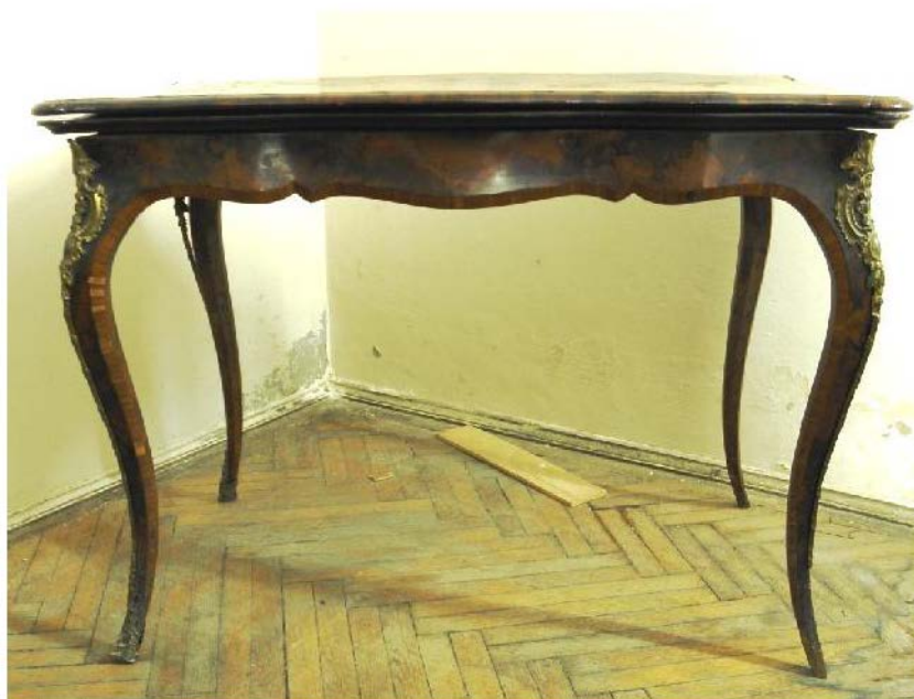
Fig. 1. Piesa înainte de restaurare.