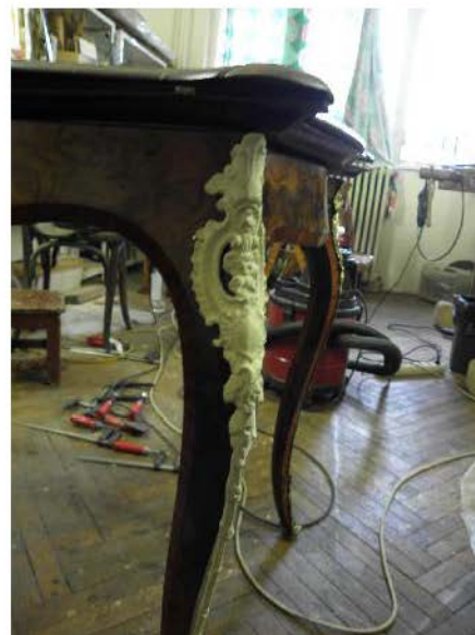
Fig. 23-28. Confectionarea de replici după elementele decorative.