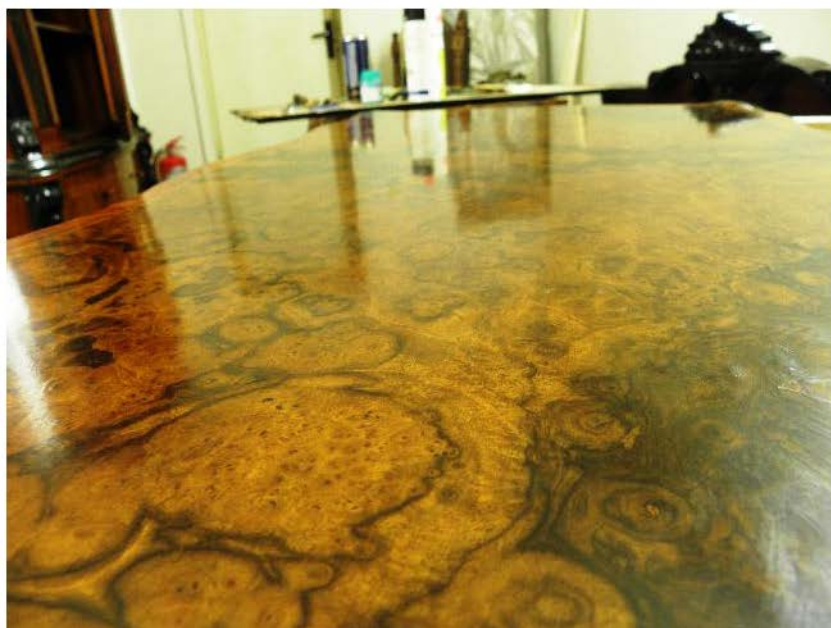
Fig. 45 și 46. Finisajul blatului în tehnica french polish .