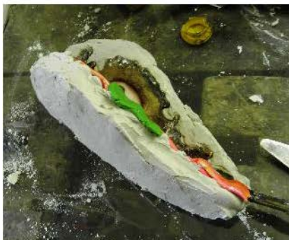
Fig. 20-22. Realizarea unei matrițe din ipsos, pentru confecționarea unor replici, în vederea completării elementelor decorative lipsă.