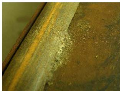
Fig. 13 și 14. Depuneri consistente de murdărie și alte forme de degradare.

Am început prin detașarea blaturilor de corpul țarcului, altă operațiune fiind cea de efectuare a maritorilor fotografici intermediari. În timpul acestor operațiuni, am descoperit elementul care atesta datarea precisă, și anume o etichetă conținând trei elemente foarte importante: numele celui pentru care a fost făcută masa, un anume HON. MR. HOPE , data efectuării comenzii, precum și numărul de comandă din registrul firmei respective.