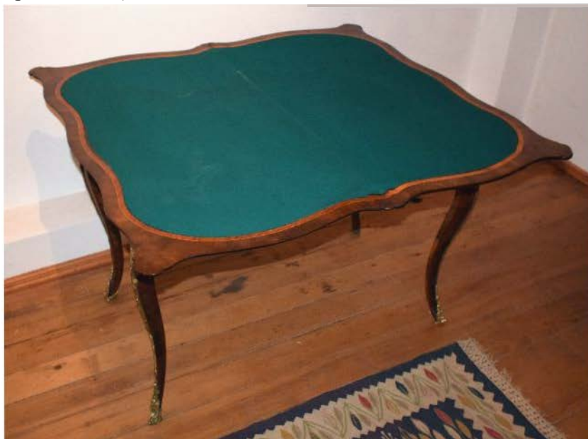
Fig. 49-51. Piesa după restaurare.