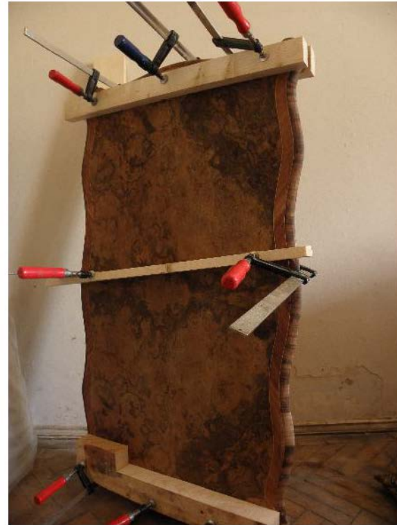
Fig. 34 și 35. Presarea blaturilor în vederea rectificării planității.

După toate aceste operații, bordura blaturilor a fost completată cu masiv, reîntregindu-se în felul acesta, rama de contur. În același timp, zonele lacunare, de pe conturul interior al șarcului și al picioarelor, a fost de asemenea completată cu fumir. Reintegrarea cromatică am efectuat-o cu ajutorul unor pensule, folosind diferite nuașe de baie, diluat în alcool etilic.