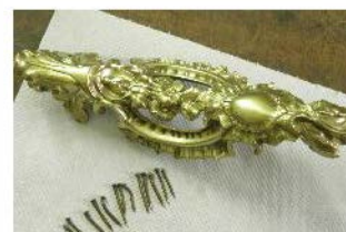
Fig. 18 și 19. Desprinderea elementelor din alamă de pe picioarele măsuței.

Fig. 20-22. Realizarea unei matrițe din ipsos, pentru confecționarea unor replici, în vederea completării elementelor decorative lipsă.