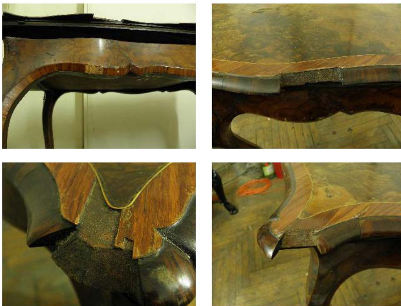
Fig. 4-7. Zone lacunare de fumir și lemn pe bordura blaturilor și de pe conturul interior al țarcului.

Operațiunile de restaurare au avut ca scop readucerea, la forma inițială, a măsuței. În prima fază, au fost efectuate fotografiile martor, procesul continuând cu efectuarea unui plan de acțiune bine stabilit: alegerea materialelor și pregătirea sculelor (un alt pas deosebit de important). În baza observațiilor amănunțite asupra piesei, procesul de restaurare va fi unul lent, având în vedere atât vechimea, cât și valoarea ei istorică.