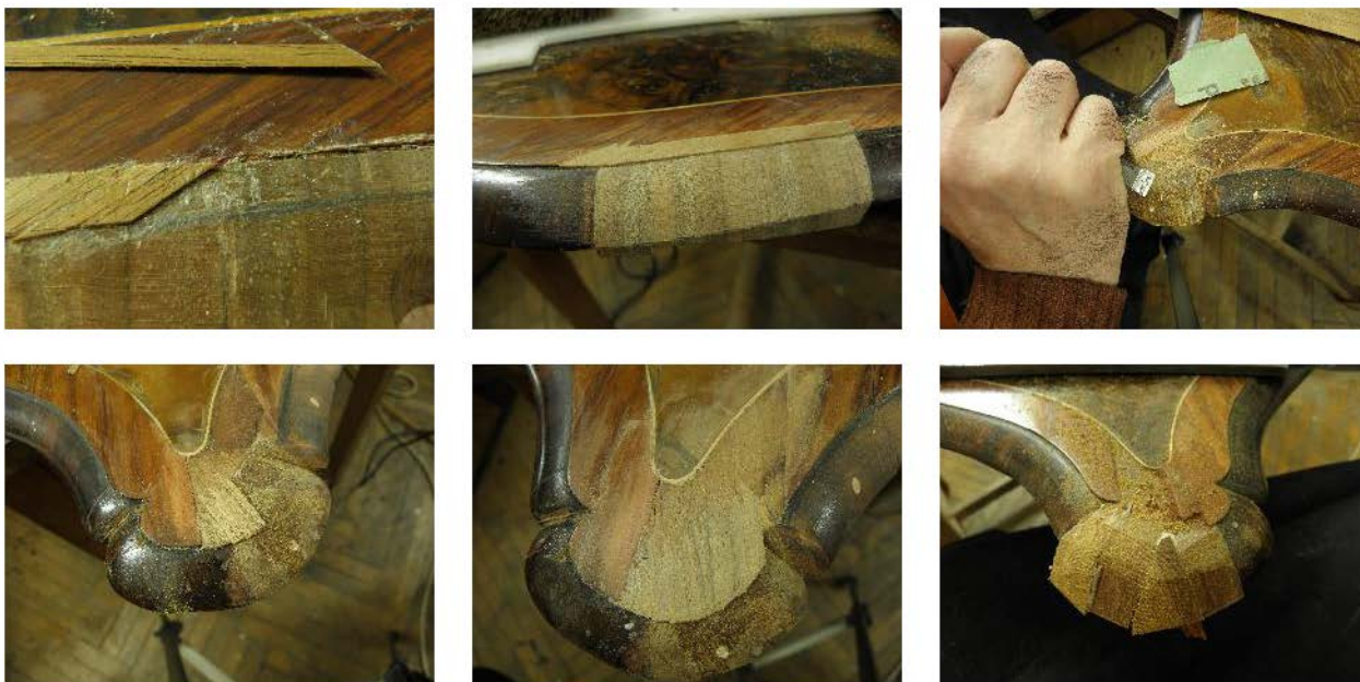
Fig. 38-43. Completări cu lemn și fimir.

Finisajul a fost refăcut prin tehnica french polish , păstrându-se astfel specificul perioadei din care face parte măsura de joc de cărți.