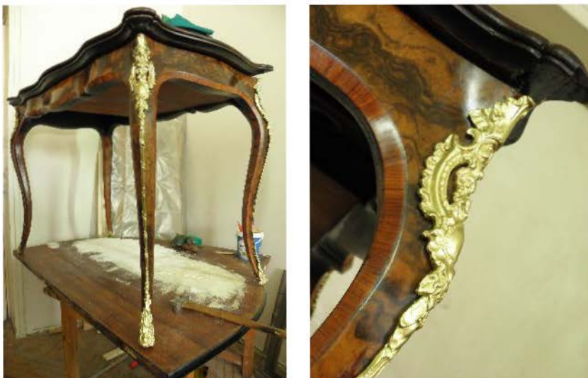
Fig. 47 și 48. Montarea elementelor decorative.