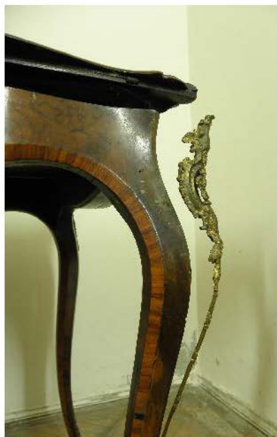
Fig. 10 și 11. Desprinderi și forme de degradare la elementele metalice decorative.