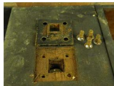
Fig. 33. Oefacerea și curățarea sistemului de rotire al blatului.

Aceste părți componente au fost confecționate dintr-o singură bucată din lemn de mahon, bordurate, cu un masiv de esență tare. Acest fapt a dus la un răspuns pozitiv la contactul cu variațiile mari de temperatură și umiditate, efectul fiind vizibil pe ambele foi. Prin urmare, ambele foi ale blaturilor au fost supuse unui proces de rectificare a planietății, prin presarea lor timp de câte o săptămână.