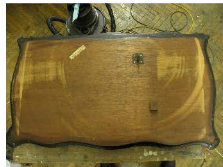
Fig. 15-17. Aspecte din timpul detașării blaturilor de corpul țarcului.

Toate aceste lucruri pot fi la un moment dat subiectul unei lucrări de cercetare, mai profunde, care să clarifice legătura dintre misteriosul personaj și Alexandru G. Golescu. Continuând firul procesului de restaurare, după detașarea blaturilor, am procedat la desprinderea elementelor din alamă de pe picioarele măsuței.