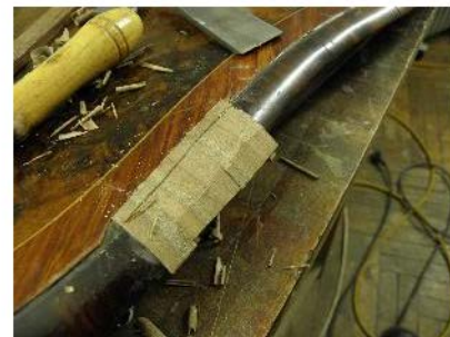
Fig. 36 și 37. Completări cu lemn.