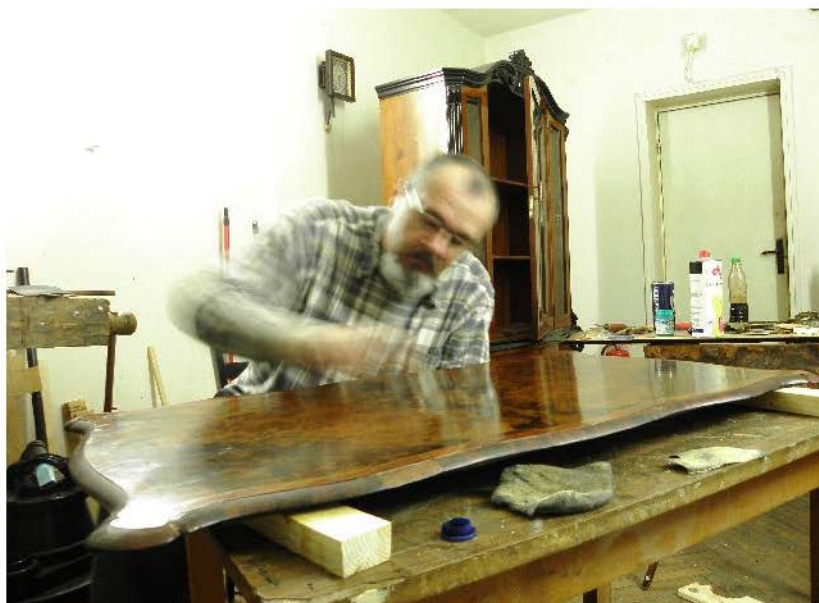
Fig. 44. Finisajul blatului.