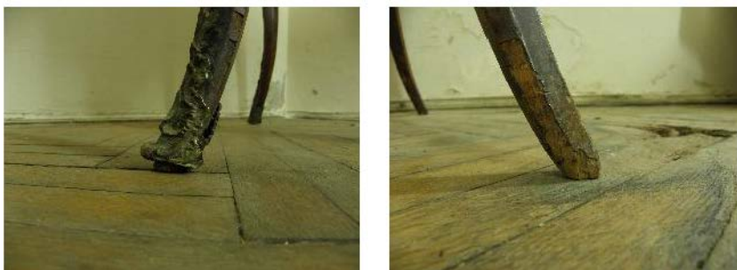
Fig. 8 (stânga). Forme de degradare la picioarele mesei. Fig. 9 (dreapta). Elemente metalice decorative lipsă la piciorul mesei.

Operațiunile de restaurare au avut ca scop readucerea, la forma inițială, a măsuței. În prima fază, au fost efectuate fotografiile martor, procesul continuând cu efectuarea unui plan de acțiune bine stabilit: alegerea materialelor și pregătirea sculelor (un alt pas deosebit de important). În baza observațiilor amănunțite asupra piesei, procesul de restaurare va fi unul lent, având în vedere atât vechimea, cât și valoarea ei istorică.