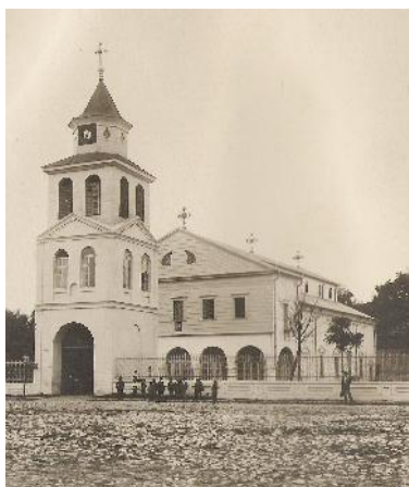
Fig. 3. Fotografie - Biserica Sf. Gheorghe Tulcea.

Acest an este menționat eronat, în anumite surse, ca an al construcției bisericii, tot acum, în 1869, fiind donat un rând de Sfinte Vase din argint, cu poanson, ce arată proveniența rusească, o carte de cult (Slujba