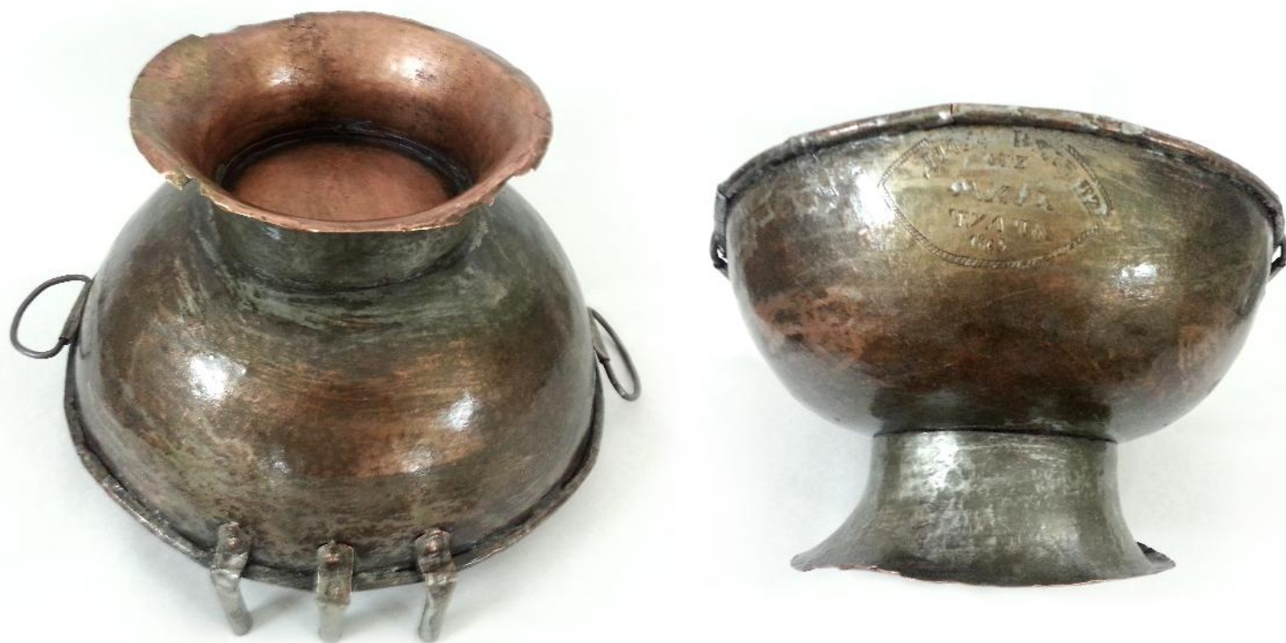
Fig. 5 și 6. Agheasmatar - aspecte din timpul restaurării.

Pentru noi aceasta a fost o mare provocare, întrucât deschidea numeroase ipoteze care scăpau unei înțelegeri firești. Atât donatorul sau meșterul cu nume bulgăresc, trebuiau să fie dintr-o localitate din Bulgaria Imperiului Otoman.