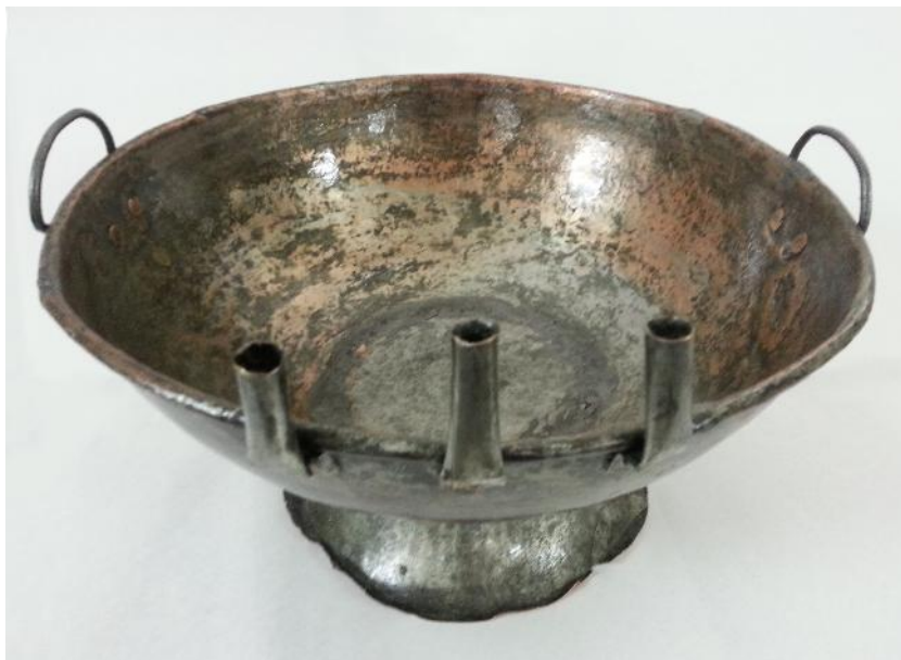
Fig. 2. Agheasmatar - aspect din timpul restaurării.

Din punct de vedere al funcționalității, vasul este utilizat în lăcașurile de cult pentru pregătirea apei sfințite, care este una dintre cele mai frecvente ierurgii ale Bisericii Ortodoxe.