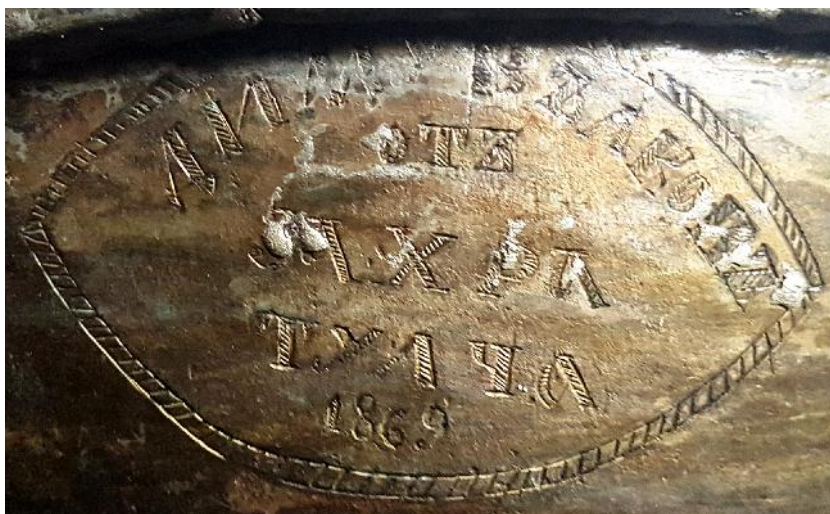
Fig. 4. Agheasmatar - detaliu medalion.

Dacă numele Dimu ori Vâlcov (ne sunt cunoscute și întâlnite și în alte contexte și localități din Dobrogea) nu ridică probleme, cel mai dificil a fost traducerea și identificarea numelui sau a localității Zahra, pe care inițial nu am putut-o identifica pe harta actuală a Bulgariei, majoritatea localităților cu acest nume fiind situate în spațiul islamic, începând cu Turcia și până în Orientul Apropiat.