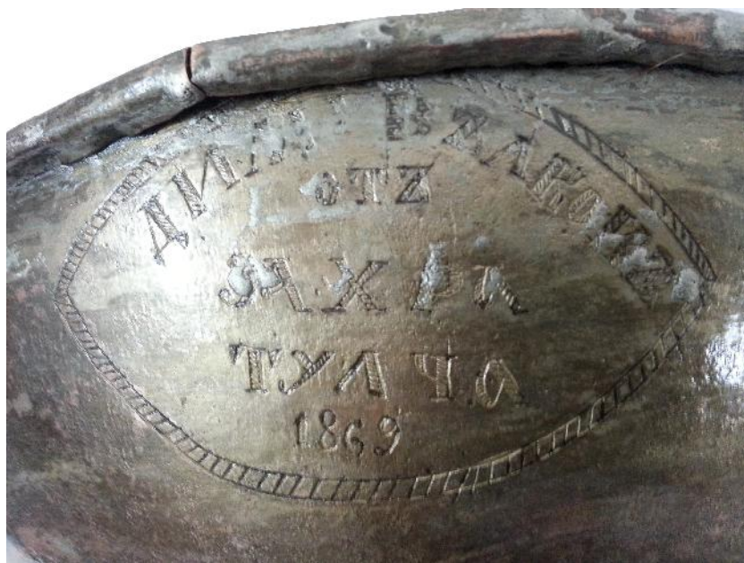
Fig. 7. Agheasmatar - detaliu medalion după restaurare.

Un vas de cult ca agheasmatarul ne face să înțelegem mai îndeaproape obiceiurile religioase neschimbate, sau prea puțin schimbate ale înaintașilor, iar prin inscripțiile pe care le poartă, ne face să cunoaștem circulația operelor de artă, a valorilor și a ideilor, dincolo de granițele temporare ale imperiilor ori statelor, precum și faptul că grija (prin donație simplă sau ctitorie), față de Biserică, a constituit, atât în Imperiul Otoman, cât și astăzi, o constantă în viața spirituală a credincioșilor de etnii diferite.