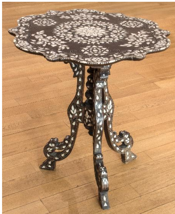
Fig. 6 și 7. Obiectul după restaurare.