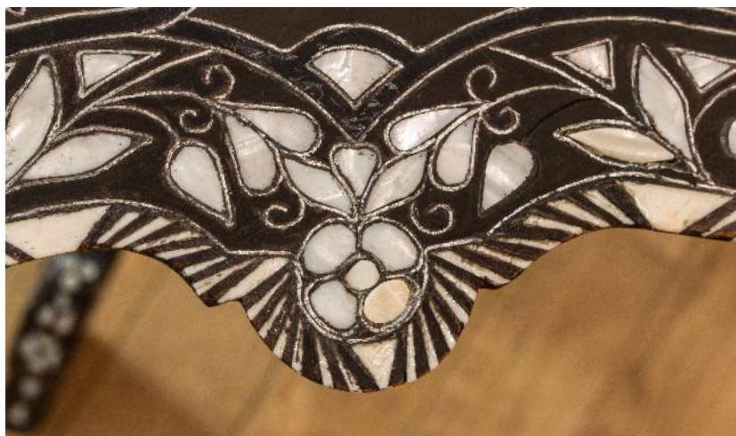
Fig. 4. Obiectul după restaurare (detaliu). Completarea elementelor lipsă din cositor și sidef.

Desprăfuirea generală a fost executată prin pensulare și aspirare. Pentru această operație s-au utilizat pensule moi și aspre, în funcție de zonele în care se acționează. Curățarea depunerilor de murdărie de la baza picioarelor s-a realizat folosind tampoane de vată îmbibate în apă distilată.