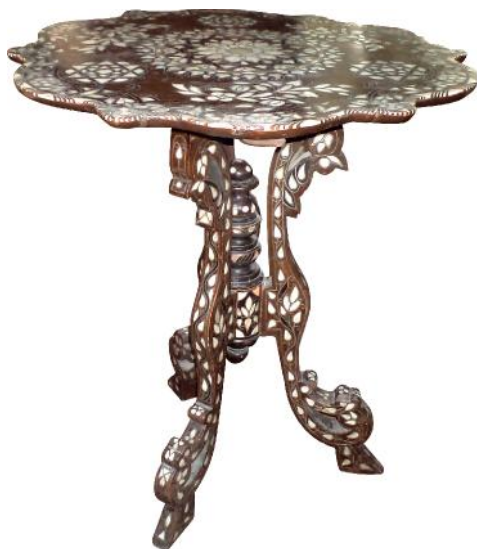
Fig. 1. Obiectul înainte de restaurare.

Keywords: mother of pearl, intarsia, furniture, folk creation.