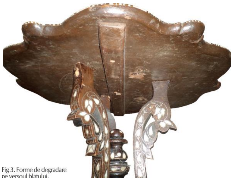
Fig. 3. Forme de degradare pe versoul blatului.

Există lacune în masa lemnoasă, sunt lipsă elemente decorative din sidef și cositor, există completări neadecvate, iar blatul era desprins de picioare, obiectul fiind parțial demontat.