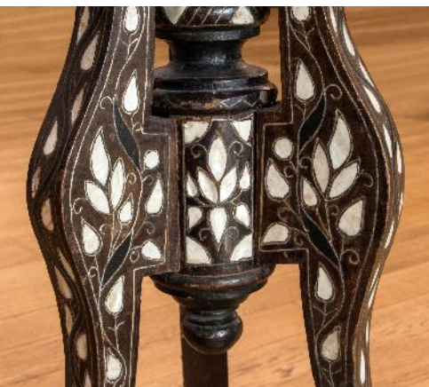
Fig. 5. Obiectul după restaurare (detaliu).

Pentru remontarea elementelor desprinse s-a efectuat curățarea zonelor de lipire, prin îndepărtarea cleiului casat și a impurităților din zona de lipire. Aceste operațiuni s-au realizat cu ajutorul tampoanelor de vată, îmbibate în apă distilată, și cu spatule optime.