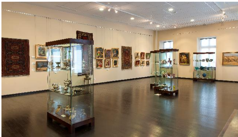
Fig. 3. Colecția Iosif Iser.

Anecdotele au fost înlocuite de informații verificate prin surse, și s-a încercat contextualizarea lor, astfel încât să fie scoase din sfera senzaționalismului și explicate conform practicilor vremii, nu al percepției actuale. Documentarea pentru prezentări a însemnat lectura, pe cât posibil, a întregii bibliografii dedicate atât colecționarilor cât și artiștilor principali din colecții, identificarea, din sursele bibliografice, a lucrărilor de referință ale colecțiilor, înțelegerea motivațiilor care au determinat alegerea fiecărei lucrări, cât și ce însemnau anumite gesturi, precum un cadou între artist și colecționar. De cele mai multe ori, artistul preferat al colecționarului beneficia de o prezentare biografică și de o descriere critică a lucrărilor din colecție, încercând să completez, în parcursul biografic, relația artistului cu colecționarul.