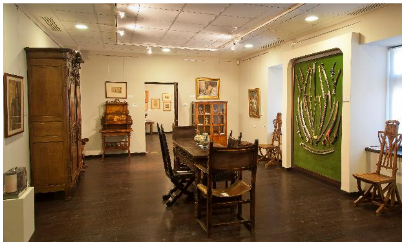
Fig. 4. Colecția de artă comparată Alexandră și Barbu Slătineanu.