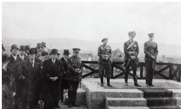
Foto 5. Regele Carol al II-lea la inaugurarea Obeliscului în 14 oct. 1937.