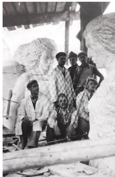
Foto 2 și 3. Imagini din perioada realizării monumentului.

în practică proiectarea artistică a monumentului, partea de arhitectură a noului edificiu albaiulian și diligența tehnică a șantierului care a fost deschis.