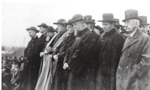
Foto 6. Personalități la inaugurarea Obeliscului în 14 oct. 1937.