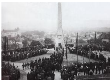
Foto 7. Inaugurarea Obeliscului în 14 oct. 1937.