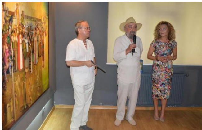
Fig. 22 și 23. Expoziția de pictură Eugeniu Barău (2017, Galeria de Artă „Dana” din Iași).

Ca urmare a muncii asidue a artistului, familia a moștenit o colecție impresionantă de lucrări. O parte dintre aceste capodopere sunt expuse, pe o perioadă nedeterminată, la Casa Colecțiilor (Casa Avramide) din Tulcea și la Restaurantul „Select” Tulcea. În calitate de reprezentant de seamă al Dobrogei și al artei românești, pe data de 28 noiembrie 2019, la ședința extraordinară a Consiliului Local Tulcea, Eugeniu Barău a primit titlul de „Cetățean de onoare al Municipiului Tulcea”.