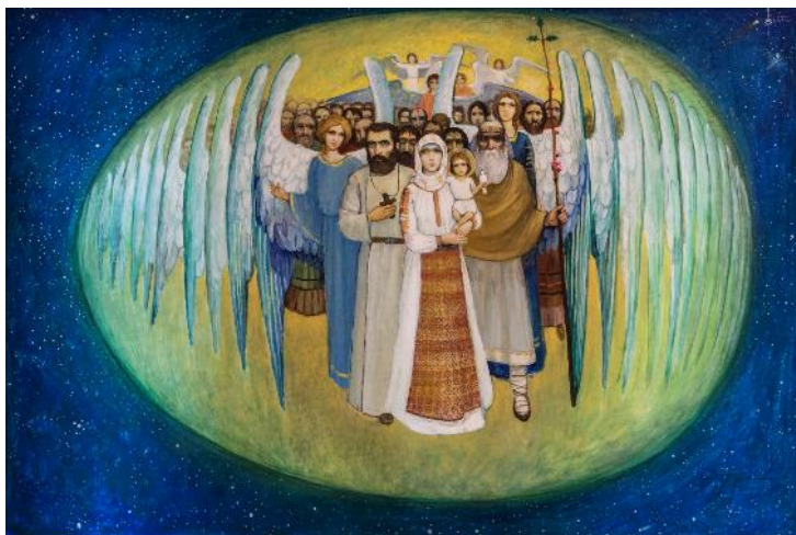
Fig. 16. „Oul Astral” (ulei / pânză; 70 x 103 cm).