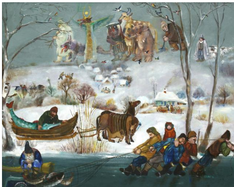
Fig. 8. „Iarna” (ulei / pânză; 65 x 81,3 cm; Colecția de Pictură; Muzeul de Artă, ICEM Tulcea).