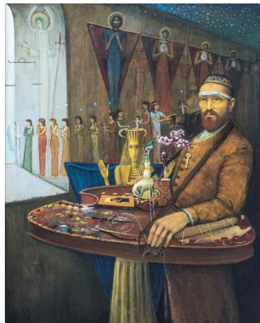
Fig. 15. „Golemul II” (ulei / pânză; 100 x 80 cm).