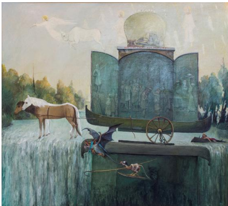
Fig. 14. „De ce v-ați omorât toți profeții?” (ulei / pânză; 90 x 100 cm).