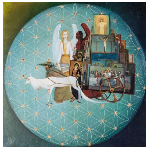
Fig. 17. „Iconarul II” (ulei / pânză; 100 x 100 cm).