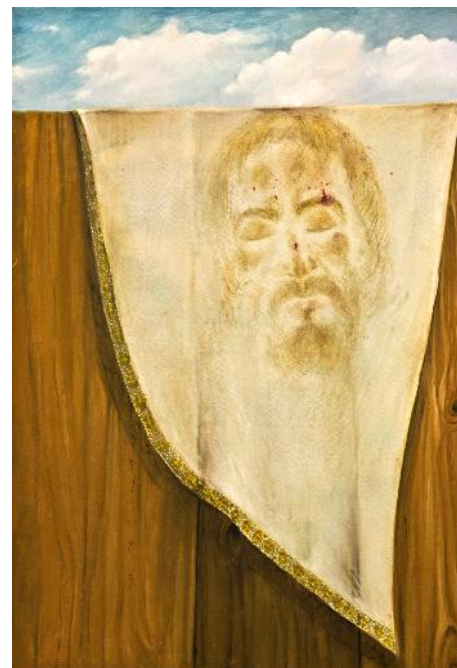
Fig. 6. „Broboada” (ulei / pânză; 73 x 50 cm; Colecția de Pictură; Muzeul de Artă, ICEM Tulcea).

Cum era și firesc, creația maestrului s-a desăvârșit în etape. Figurația narativă a început cu forme simple, arhaice. Identificându-se cu un mărturisitor, Eugeniu Barău denunța prin pictură ipocrizia, minciuna, răul sub toate formele. Compozițiile pornesc de la o temă generală ce se dezvoltă odată cu atenția și cunoașterea privitorului. Spațiul este populat de personaje surprinse în diferite ipostaze. Scenele pornesc de la analiza societății și evoluează în fantastic. Pictura ne amintește de creațiile lui Pieter Bruegel cel Bătrân și Hieronymus Bosch. Universul creativ înglobează o colecție spectaculoasă de tipologii. Dincolo de acestea, artistul observa și relatea duelul permanent dintre bine și rău.