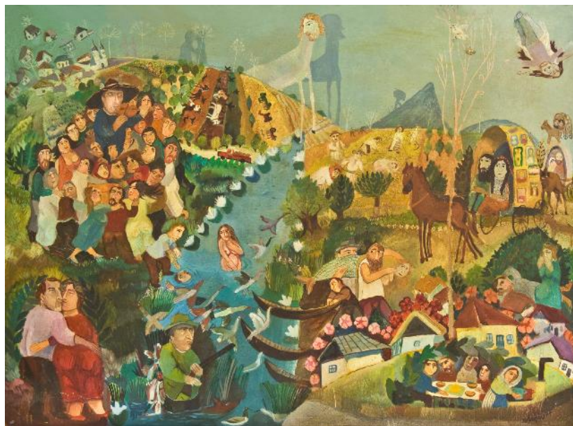
Fig. 7. „Alegorie II” (ulei / pânză; 51,5 x 69,5 cm; Colecția de Pictură; Muzeul de Artă, ICEM Tulcea).