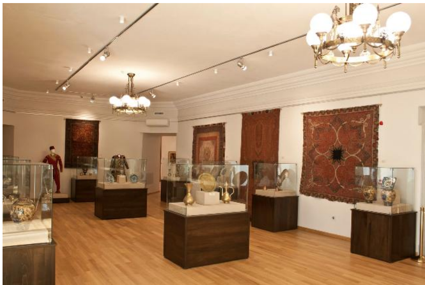
Fig. 1. Bunuri promovate în expoziția permanentă a Muzeului de Artă din Tulcea, Arte și influențe în Dobrogea .

accesorii. Articolele de îmbrăcăminte turcească sunt specifice secolelor XVIII-XIX. Ele au ajuns pe teritoriul țării noastre, cel mai probabil, ca daruri de nuntă, zestre a unor tinere și marfă comercializată.