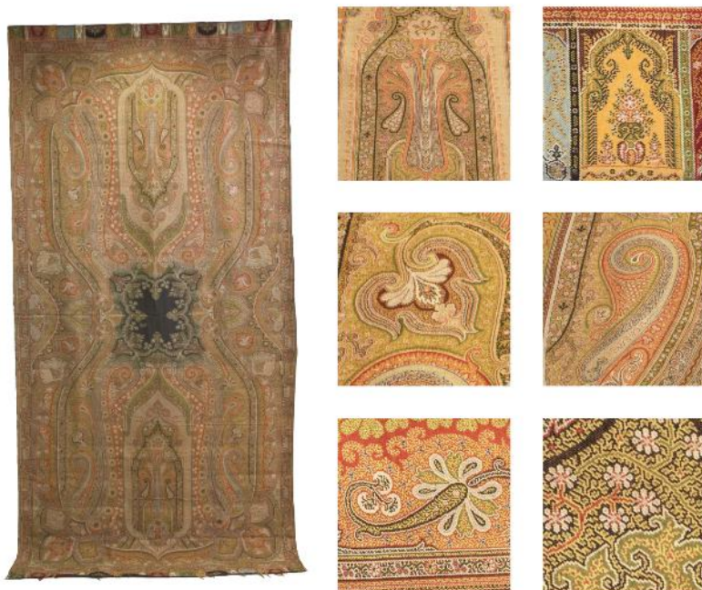
Fig. 3. Inv. nr. 2 al Colecției de Artă Decorativă Orientală: Șal (Atelier indian; Republica India; Începutul secolului al XIX-lea; lână de capră; L: 302 cm, LA: 127 cm)/ Detalii Șal persan: vază cu iriși, vas cu flori, iris, boteh , floare compusă, tufe de iasomie.

Mijloacele de exprimare ale artei orientale definesc civilizația constituită sub standardul Islamului. Este un spațiu bogat, lipsit de monotonie, o dimensiune în care credința și fascinația înveșmăntează umanitatea cu cele mai frumoase elemente din natură. El se regăsește când în interiorul ființei umane, când în mediul înconjurător. Adeseori, preluările și interpretările artiștilor și artizanilor proiectează sacrul în profan.