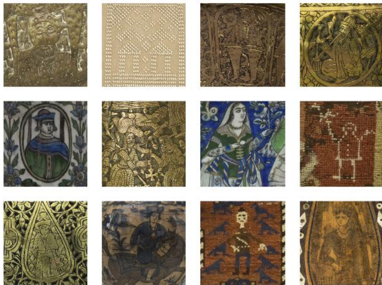
Fig. 8. Motive antropomorfe prezente în decorurile unor piese din Colecția de Artă Decorativă Orientală.

sticla, porțelanul și lemnul. Petele de culoare sunt folosite ca mijloc de reprezentare și mai puțin ca semn plastic. Acromatice și cromatice, ele sunt transparente, semitransparente și opace. Petele plate apar sub formă regulată, pictate aerat sau aglomerat. Marginile petelor sunt precise, rezultate prin aplicarea coloranților pe suport uscat, sau conturate cu linii modulate.