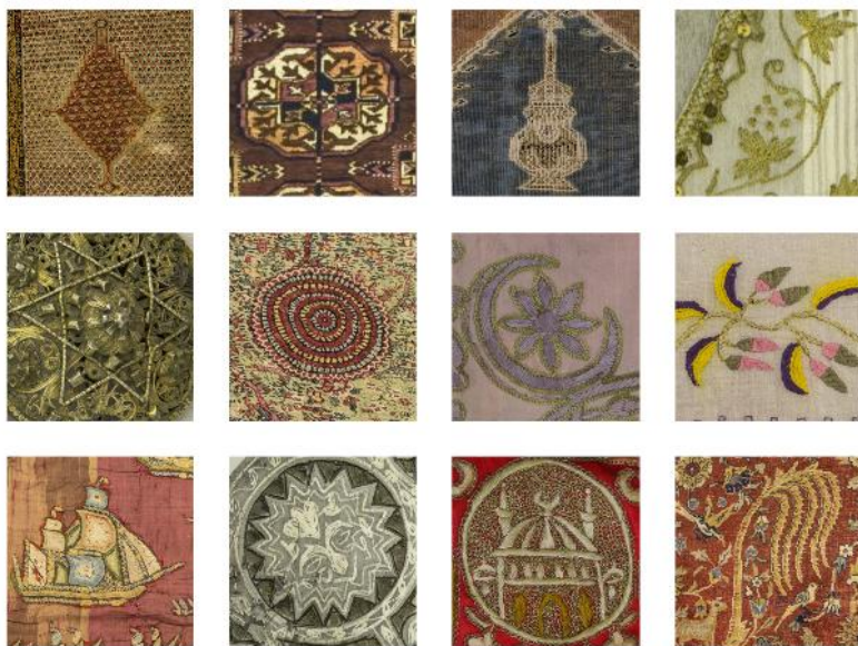
Fig. 6. Motive diverse prezente în decorurile unor piese din Colecția de Artă Decorativă Orientală: Herati , Tekke Cöl , candelabru, viță-de-vie, stea, Lună, semilună cu stea, ciușcă, corabie, Soare, moschee, palmier.

Atât câmpurile decorative, cât și spațiile figurate, par a nu avea început și sfârșit. Elementele sunt alternate, repetate, incizate, încastrate, țesute, brodate, traforate și pictate. Registrele și cartușele continue amintesc de regenerarea naturii și circuitul apei în natură. O bună parte dintre vase, cu forme generale de bulb, sămânță sau boboc, exprimă germinația plantelor. Țesăturile și unele broderii au forme și registre pătrate, respectiv dreptunghiulare. Laturile și unghiurile lor dau senzația de stabilitate. Sunt oglinzi materiale, echivalente cu inimile oamenilor, în care descoperim universul și eternul.