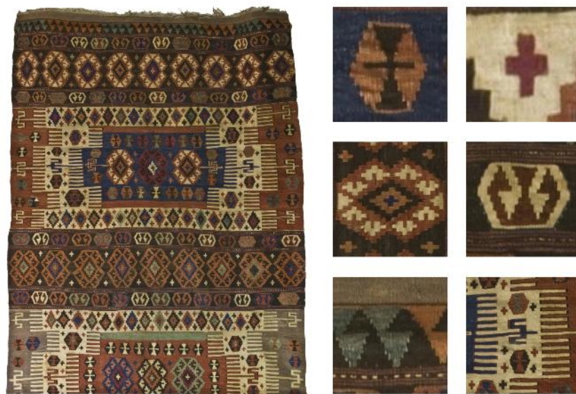
Fig. 5. Inv. nr. 36 al Colecției de Artă Decorativă Orientală: Fragment scoarță (Atelier turcesc; Republica Turcia; Secolul al XIX-lea; bumbac, lână; L: 243 cm; LA: 179 cm)/ Detalii Fragment scoarță pentru moschee: bandă de păr; cruce; brusture; cornul berbecului; cârlige; mână, deget, pieptăn.

Limbajul vizual, de o infinită diversitate și eleganță, este transmis prin nelipsitele monade plastice: punctul, linia, culoarea, pata decorativă și textura. Ele susțin și completează caligrafia.