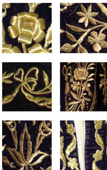
Fig. 2. Daniela Iacobleș-Barău în expoziția permanentă a Muzeului de Artă Tulcea (2012), în dreptul piesei cu inv. 56 din Colecția de Artă Decorativă Orientală: Rochie (Atelier turcesc; Republica Turcia; Secolul al XIX-lea; catifea, pânză de bumbac, fir de bumbac, fir metalic; L maximă: 152 cm, L mânecă: 48 cm) / Detalii Bindall entari: trandafir, iasomie, fundă, buchet de flori, frunză, ghirlandă.