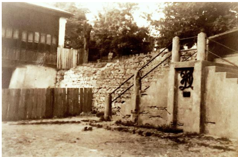
Fig. 4 și 5. Fotografii interbelice.

iscoditor a putut vedea și admira centenarul rezistenței în timp și în beton a plăcuței metalice bine ancorată în zid, până când o mână criminală a smuls-o pentru a o vinde la fier vechi.