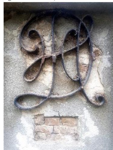
Fig. 2. Starea actuală, luna mai 2020.