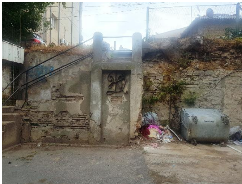
Fig. 3. Starea actuală, luna mai 2020.

Cei ce l-au construit inițial au avut cu totul alte gânduri și au fost mânați de interese sociale, filantropice, edilitare ori naționale pe care astăzi prea puțin le înțelegem la adevărata lor valoare.