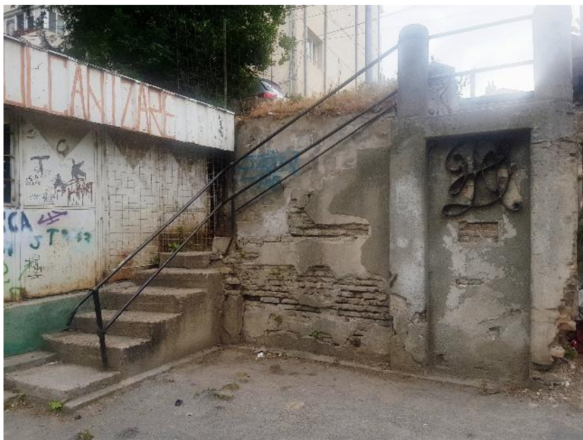
Fig. 1. Starea actuală, luna mai 2020.

realități istorice tulcene din a doua parte a secolului al XIX-lea, dar și cu necunoscute și ipoteze ce se învârt în cercul adevărului, dar mai ales cu invitații în rândul membrilor comunității pentru deslușirea, pe cât se poate, a misterului monogramei.