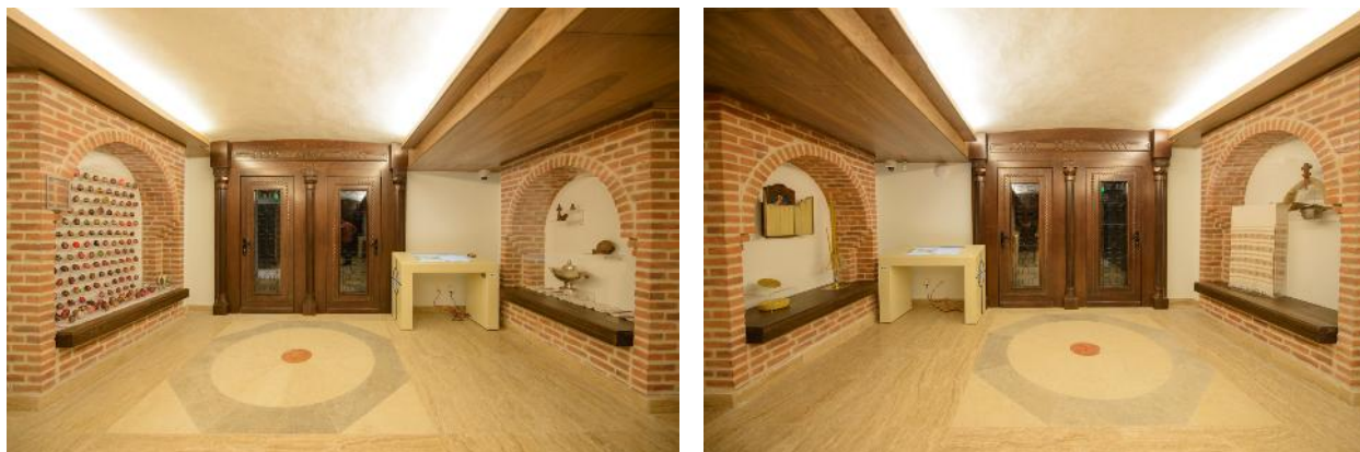
Fig. 4 și 5. Sala Ofrandă.

publicului cu mediul cultural, artistic și academic. Expunerea în acest spațiu se face predilect în vitrine. De asemenea, sala este dotată cu un panou de proiecție mare ce coboară din tavan și cu un sistem modern de sonorizare.