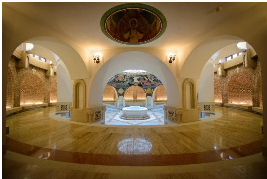
Fig. 13. Sala Baptisteriu înainte de panotare.