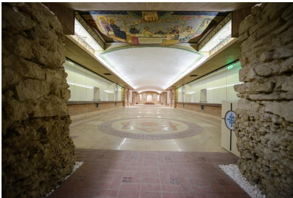
Fig. 8. Sala Ekklesia înainte de panotare.