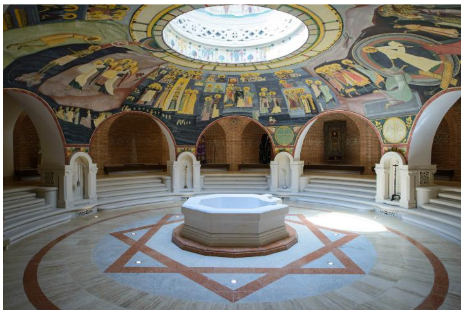
Fig. 14. Sala Baptisteriu după panotare.