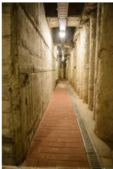
Fig. 10 și 11. Culoarul Perimetral.