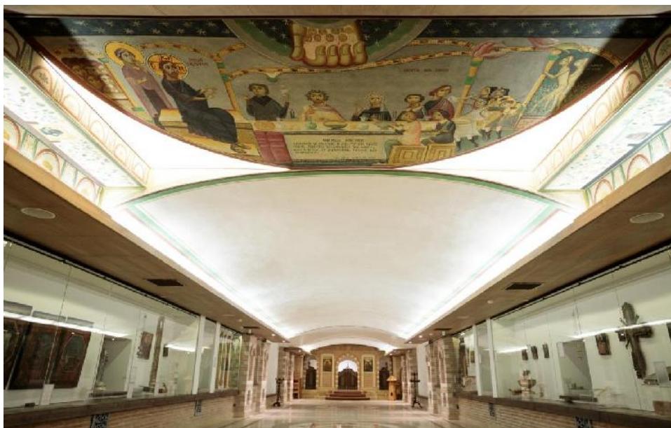
Fig. 9. Sala Ekklesia după panotare.