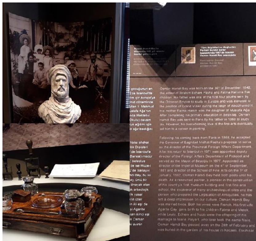
Img. 2. Osman Hamdi Bey, Muzeul de Arheologie din Istanbul.

Un moment de cotitură în dezvoltarea muzeului l-a avut numirea lui Osman Hamdi Bey (Img. 2) ca director al Muzeului Imperial. Acesta s-a născut într-o familie înstărită și cu tradiție în ocuparea de funcții administrative sau militare în cadrul Imperiului Otoman. Tatăl său, Ibrahim Edhem Pasha, a ocupat funcția de Mare Vizir sub ultimul Sultan al Imperiului Otoman, Murad al V-lea. Bunicul său, Hüsrev Pasha, a fost amiralul flotei imperiale dar și Mare Vizir, între 1839-1840. Hüsrev Pasha a adoptat mai mulți copii, printre care și pe Edhem, acesta fiind originar din insula Chios 12 , pe care i-a educat și pregătit pentru a ocupa mai multe funcții administrative în cadrul Imperiului Otoman.