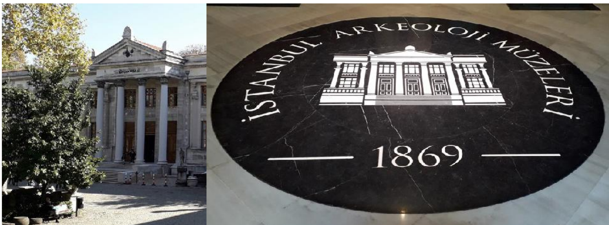
Img. 1. Muzeul de Arheologie din Istanbul.

Un moment de cotitură în dezvoltarea muzeului l-a avut numirea lui Osman Hamdi Bey (Img. 2) ca director al Muzeului Imperial. Acesta s-a născut într-o familie înstărită și cu tradiție în ocuparea de funcții administrative sau militare în cadrul Imperiului Otoman. Tatăl său, Ibrahim Edhem Pasha, a ocupat funcția de Mare Vizir sub ultimul Sultan al Imperiului Otoman, Murad al V-lea. Bunicul său, Hüsrev Pasha, a fost amiralul flotei imperiale dar și Mare Vizir, între 1839-1840. Hüsrev Pasha a adoptat mai mulți copii, printre care și pe Edhem, acesta fiind originar din insula Chios 12 , pe care i-a educat și pregătit pentru a ocupa mai multe funcții administrative în cadrul Imperiului Otoman.