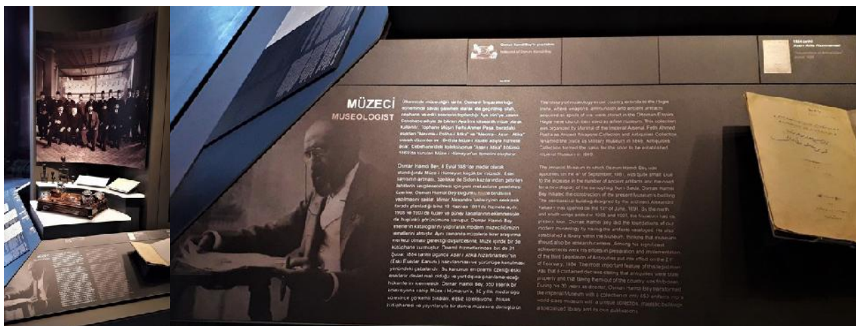
Img. 5. Osman Hamdi Bey - Fondatorul Muzeului de Arheologie și al Academiei de Arte Plastice din Istanbul.

Arheologia publică nu este o modă, ci o necesitate pentru arheologia națională, nu este un capriciu sau un moft al unor arheologi, ci respect față de profesia pe care o au, față de știință și de societate. Muzeele sunt o verigă importantă a acestui proces, fiind punctul în care individul și societatea românească se intersectează cel mai des cu arheologia și descoperirile pe care le fac arheologii, dincolo de posibilitatea, încă mult redusă la nivel național, de a vizita un sit sau/și un șantier arheologic.