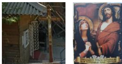
Fig. 4. 2016 - A doua Cruce de lemn .

În anul 2016 se sculptează a doua cruce de lemn, iar în 2018 cea de a treia cruce de lemn. Pentru ambele obiecte de cult s-a folosit dulap de lemn de tei, uscat, cu grosime de 10 cm, lățime de 10 cm și înălțime de 1,5 m, prelucrat prin incizie și crestare manuală, „meplat” (basorelief). În centrul compoziției, pe ambele cruci s-a sculptat scena Răstignirii Mântuitorului Nostru Iisus Hristos și s-au aplicat plăcuțe de lemn, cu inscripția INRI (Iisus Nazarineanul, Regele Iudeilor). De asemenea, s-au aplicat diferite tratamente pentru a mări rezistența lemnului la funghi, insecte și la intemperii, și produse speciale de finisare (băiț, lac protector) care oferă rezistență mărită la biodegradare.