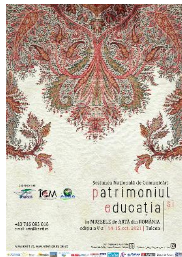
Fig. 1. Afișul Sesiunii Naționale de Comunicări „Patrimoniul și educația în Muzeele de Artă din România”, ediția a V-a, 2021, la care s-a participat cu prezentarea „Crucea de lemn - de la copac la obiect de cult”.

***muzeograf IA, Centrul Muzeal Ecoturistic „Delta Dunării”, ICEM Tulcea