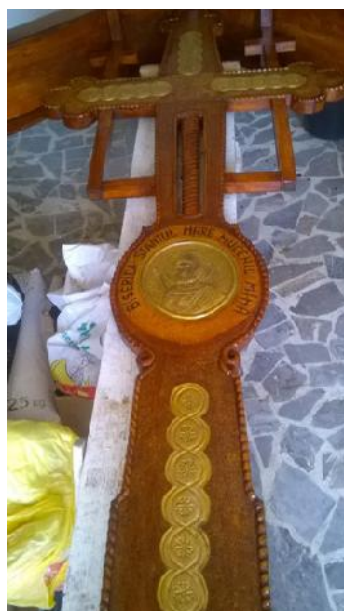
Fig. 2. 2012 - Prima Cruce de lemn, etape de lucru.