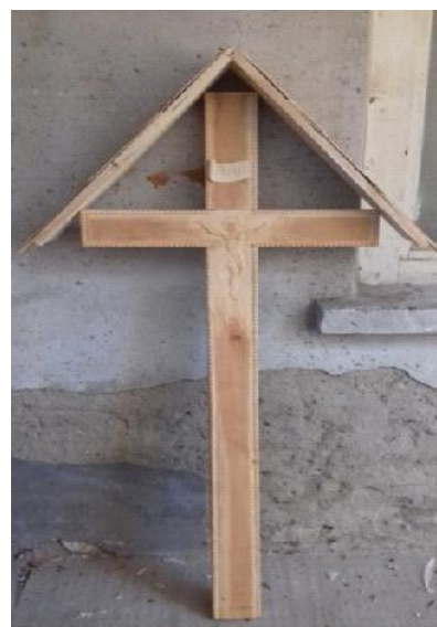
Fig. 6. Etape de lucru în atelier.