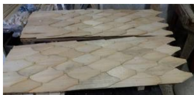
Fig. 5. 2018 - A treia Cruce de lemn .

Ambele cruci sunt protejate de un acoperiș (două scânduri late fixate în unghi, sus „în vârful” crucii și pe capetele brațului orizontal) cu șindrilă, în două ape (care să o protejeze împotriva apei pluviale), iar la a treia cruce de lemn s-a aplicat și foiță de aur. [Fig. 4-6]