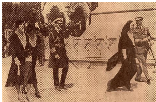
Parastasul de la Curtea de Argeș în memoria regelui Ferdinand I: regele Carol al II-lea, regina Maria, principesa Elena, principele Nicolae, principesa Ileana ieșind din catedrala episcopală după parastas și îndreptându-se către palatul regal din curtea mănăstirii (Ilustrațiunea Română, nr. 32, anul II, joi, 31 iulie 1930, Redacția și Administrația: Ziarul „Universul”, București, p. 2).

În vara anului 1930, însoțind-o pe mama sa, regina Maria, într-o vizită în Spania, principesa îl întâlnește pe arhiducele Anton de Habsburg, un băiat frumos, înalt, blond, sportiv, distins. Principesa Ileana îi cere fratelui său, regele Carol al II-lea, ca șef al Casei Regale, binecuvântarea și consimțământul pentru căsătoria cu arhiducele Anton de Habsburg, pentru că tatăl său murise în anul 1927. În 1931, arhiducele vine în România, ca logodnic al principesei Ileana, fiind întâmpinat la Aeroportul Băneasa de către regina Maria, principesa Ileana și un grup de cercetașe.