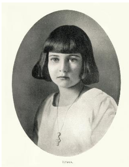
Principesa Ileana a României, circa 1915 (Marie, Queen of Romania, The Story of My Life , volume III, Cassell and Company, Ltd. London, Toronto, Melbourne and Sydney, first edition, 1935, planșă p. 22).

Imaginea de pe cartea poștală ilustrată pentru colecția Societății „Amicii Orbilor” se identifică și în volumul al III-a din lucrarea The Story of My Life , 1935. Principesa Ileana, bust, poartă o rochie de culoare deschisă, iar la gât un lanț cu o cruce. Pe cartea poștală ilustrată apare în partea de sus a imaginii următoarea mențiune: COLECȚIA SOC. „AMICII ORBILOR”, iar în partea de jos: A.S.R. PRINCEPESA ILEANA. Pe revers, UNION POSTALE UNIVERSELLE, ROMANIA, CARTA POSTALA.