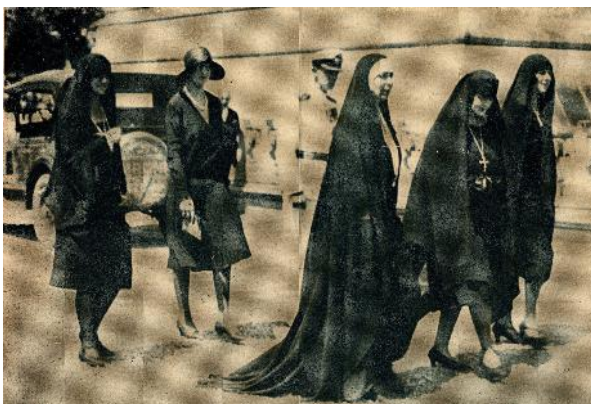
Regina Maria, regina Elisabeta a Greciei, regina-mamă Elena, principele regent Nicolae, principesa Ileana și principesa Irina a Greciei ieșind de la mănăstire după parastasul de doi ani de la moartea regelui Ferdinand I, la catedrala de la Curtea de Argeș (Ilustrațiunea Română, nr. 6, anul I, joi, 1 august 1929, Redacția și Administrația: Ziarul „Universul”, București, p. 2,).