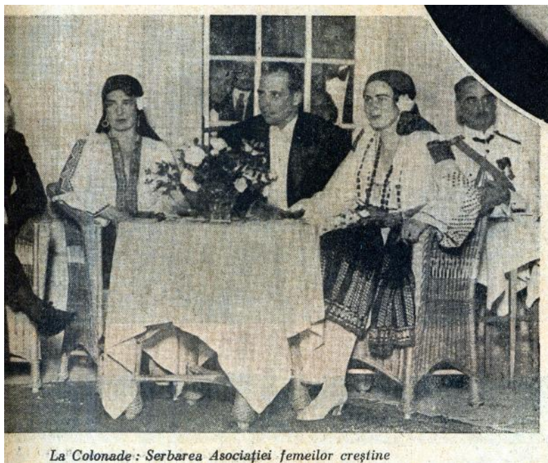
La Colonade : Serbarea Asociației femeilor creștine

( Ilustrațiunea Română , nr. 31, anul II, joi, 24 iulie 1930, Redacția și Administrația: Ziarul „Universul”, București, pe copertă, Julietta, fotograful Curții Regale).