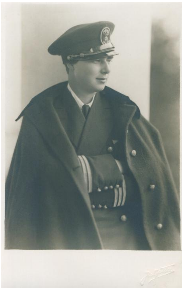
Principesa Ileana în uniformă de la școala de Marină, 1929 (carte poștală ilustrată, Julietta, Agfa Photo, colecția Muzeului Național Bran, nr. inv. I. 96).

„Dar cea mai mare pasiune a copilei cu ochi albaștri a fost marea. A devenit o înotătoare de mâna întâi și, cu dorința ei de a face totul temeinic, s-a apucat să studieze navigația; așa cum făcea și în copilărie, a insistat și acum să fie supusă unei examinări adevărate, în fața unei comisii navale, ca și cum ar fi fost un ofițer”, nota regina Maria în 1931, în povestirea Principesa Ileana – Copila cu ochi albaștri 12 .