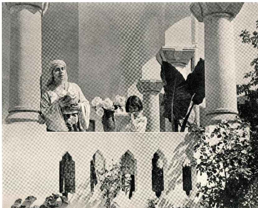
Principesa Ileana și regina Maria

(Marie, Queen of Romania, The Story of My Life , volume III, Cassell and Company, Ltd. London, Toronto, Melbourne and Sydney, first edition, 1935, planșă p. 395).