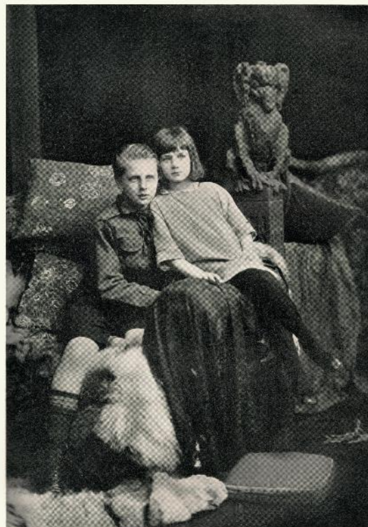
NICKY AND ILEANA.

(Marie, Queen of Romania, The Story of My Life , volume III, Cassell and Company, Ltd. London, Toronto, Melbourne and Sydney, first edition, 1935, planșă p. 198).