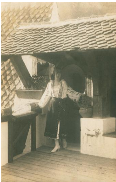
Principesa Ileana a României în costum popular românesc pe terasa de la etajul al IV-lea al Castelului Bran (carte poștală ilustrată, colecția Muzeului Național Bran, nr. inv. I. 23).

După refugiul de la Iași, care a fost foarte greu pentru familia regală, simțind direct toate lipsurile și greutatea cu care se confrunta populația, în iulie 1918 familia regală s-a mutat la Bicz, într-o casă din domeniile Coroanei, în frumoasa vale a Bistriței 5 . În lucrarea The Story of My Life , volumul III, principesa Ileana apare pe balconul casei, împreună cu regina Maria.