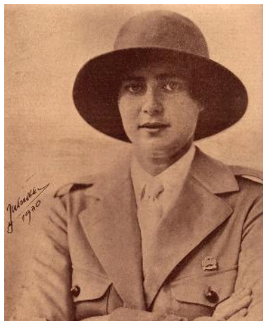
Princesesa Ileana în uniformă de cercetaș, 1930

În septembrie 1925, principesa Ileana a plecat la studii în Anglia, la Liceul Heathfield din Ascot 9 . „În timpul anului de școală pe care l-am petrecut în Anglia, m-am alăturat grupului de Girl Guides și am urmat cursurile lor.” 10 – nota principesa în memoriile sale. De asemenea, principesa menționa: „M-am aruncat cu entuziasm în toate mișcările de tineret care se formau pe vremea aceea și în acest fel am putut să-i cunosc mai aproape pe tinerii din țara mea” 11 . Girl Guides era o mișcare de tineret, corespondentul feminin al cercetășiei înființate de lordul Baden-Powell din Marea Britanie. Princesesa Ileana s-a numărat printre fondatorii Asociației Ghidelor și Ghizilor din România (1928), a Asociației Cercetașele României (1930), de asemenea, s-a implicat și în altă mișcare de tineret: Asociația Creștină a Femeilor Române , fiind președintă de onoare în perioada 1938-1948. În revista de știri mondene, Ilustrațiunea Română apărută în 1929, supliment al ziarului Universul , unele instantanee mondene o aveau ca protagonistă pe principesa Ileana a României.