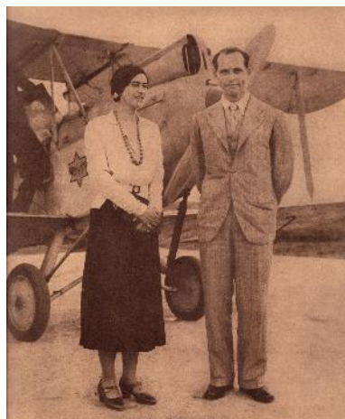
Principesa Ileana cu logodnicul său, arhiducele Anton de Habsburg, Băneasa, 1931

( Ilustrațiunea Română, nr. 26, anul III, miercuri, 24 iunie 1931, Redacția și Administrația: Ziarul „Universul”, București, pe copertă,).