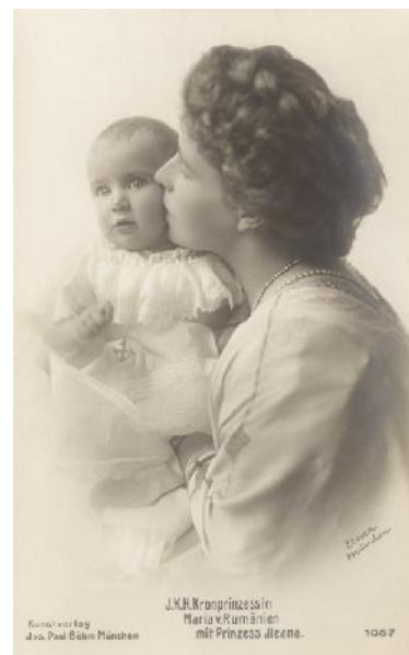
Princesa Maria a României și mica principesă Ileana a României (carte poștală ilustrată, Elvira, Kunstverlag Jos. Paul Böhm, München, http://www.tkinter.smig.net/ PrincessIleana/Gallery/index.htm ).

Princesa Ileana a României a fost fiica cea mică a regelui Ferdinand I și a reginei Maria. S-a născut la București, la 5 ianuarie 1909. Regina Maria scria în Povestea vieții mele : „S-a născut în 1909 când nu mai eram chiar așa de tânără, viața mă domesticise până la un punct oarecare, eram o ființă mai conștientă, caracterul meu ajunsese la maturitate, învățasem să mă stăpânesc și să privesc viața și întâmplările drept în față. Nașterea Ilenei a fost o mare fericire pentru mine și mă bucurai că aveam încă o fetiță. Mi-aduc aminte cum stam întinsă pe spate după ce se săvârșise lupta, strângând la piept noua mică pribeagă a vieții și