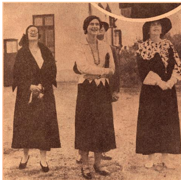
Regina Maria și principesa Ileana, în așteptarea avionului care l-a adus pe arhiducele Anton de Habsburg, Băneasa, 1931 (Ilustrațiunea Română, nr. 26, anul III, miercuri, 24 iunie 1931, Redacția și Administrația: Ziarul „Universul”, București, p. 2).

În vara anului 1930, însoțind-o pe mama sa, regina Maria, într-o vizită în Spania, principesa îl întâlnește pe arhiducele Anton de Habsburg, un băiat frumos, înalt, blond, sportiv, distins. Principesa Ileana îi cere fratelui său, regele Carol al II-lea, ca șef al Casei Regale, binecuvântarea și consimțământul pentru căsătoria cu arhiducele Anton de Habsburg, pentru că tatăl său murise în anul 1927. În 1931, arhiducele vine în România, ca logodnic al principesei Ileana, fiind întâmpinat la Aeroportul Băneasa de către regina Maria, principesa Ileana și un grup de cercetașe.