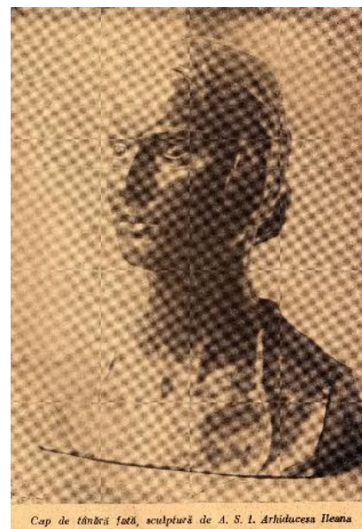
Cap de tânără față, sculptură de A. S. I. Arhiducesa Ileana