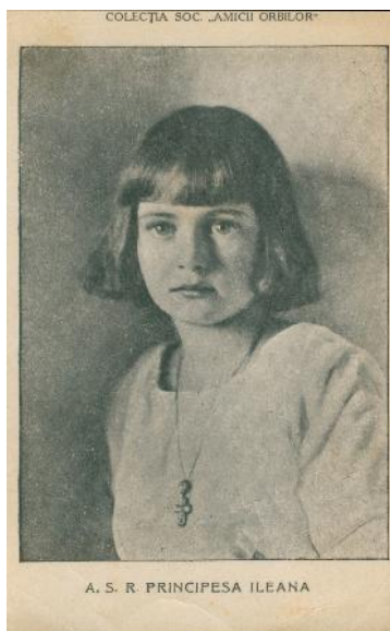
Principesa Ileana a României (carte poștală ilustrată, colecția Muzeului Național Bran, nr. inv. I. 68).

Carol, fratele cel mare, născut în 1893, era cel mai apropiat de principesa Ileana, acesta îi citea basme și o plimba cu trenulețul, iar mica principesă chiuia de bucurie. Când Carol avea 20 de ani și Ileana avea patru ani, principele a fost nevoit să se îndepărteze de sora lui pentru care avea o afecțiune deosebită, datorită îndatoririlor lui princiare și preocupărilor de adult 2 .