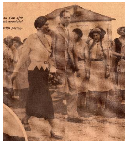
Principesa Ileana cu logodnicul său, arhiducele Anton de Habsburg, trecând în revistă cercetașele ce au venit la Băneasa să-i salute, 1931

( Ilustrațiunea Română, nr. 26, anul III, miercuri, 24 iunie 1931, Redacția și Administrația: Ziarul „Universul”, București, pe copertă,).