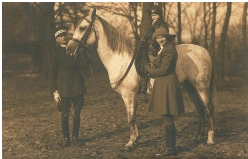
Principesa Ileana a României și principele Mihai (carte poștală ilustrată, colecția Muzeului Național Bran, nr. inv. I. 95).

Radule dragă, Mec pentru scrisoare - Nu am vreme să ți scriu mult fiindcă momentele libere le petrec cu Tata săracu. Vai ce spaimă am avut. Pentru moment e mult mai bine ca morală; altfel natural tot mare pericol. Mignon a venit alaltăeri și e un înger, ține pe toți la locul lor; îl liniștește pe Tata, îi dă de mâncare; și infine tot - Lisabeta sărac[a] e disperată ca noi toți dar sărmana nu știe ce să fac și cum să se poartă cu Tata. Mama natural e o minune dar și ea și-a pierdut răceala.