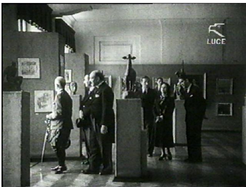
Fig. 3 și 4. Deschiderea oficială a expoziției membrilor secțiunii artistice de la Accademia di Romania, 5 mai 1937.