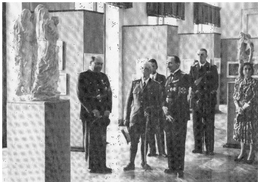
Fig. 5. Vernisajul expoziției anuale colective a secțiunii artistice de la Accademia di Romania, 21 mai 1940. De la stânga la dreapta, istoricul Emil Panaitescu, Regele Italiei, Vittorio Emanuele di Savoia al III-lea, ambasadorul Raoul Bossy. În spatele suveranului, parțial vizibil, sculptorul Ion Lucian Murnu.