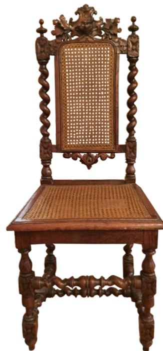
Foto 3. Scaun în stil Jacobean.

Astfel a apărut scaunul „farthingale”(crinolină), construit din stejar, fără mâner, pentru a permite doamnelor să stea cât mai comod. Mobila