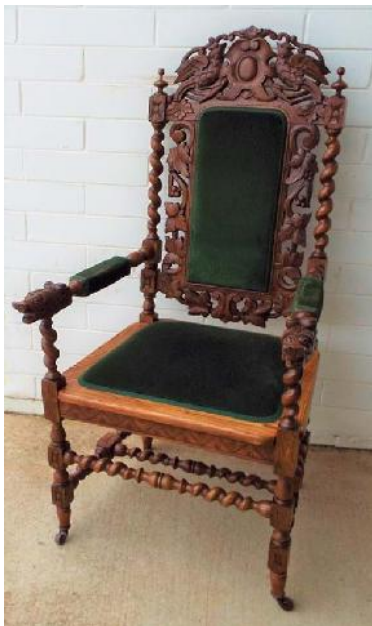
Foto 1. Scaun în stil Jacobean.

Era Jacobeană este încă o fază a Renașterii în Anglia, manifestată în arhitectură, teatru și decorare și începută în era Elizabethană. Acest stil influențează stilul de construcție a mobilei din America numit și Pilgrim.