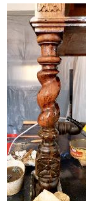
Foto 18-25. Îndepărtarea stratului de lac protector degradat și a depunerilor aderente.