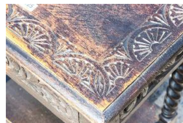
Foto 7-8. Imagini analog pentru identificarea elementelor decorative.