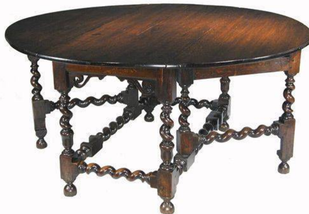
Foto 4-5. Mese în stil Jacobean.

continuă tradiția Elizabethană de construcție solidă, viguroasă din stejar cu linii drepte, design rigid și construcție masivă. Suprafața mobilei era ceruită pentru protecția lemnului. Această ceară se tot acumulează pe mobilă, dând un luciu închis, antic, caracteristic pieselor din acea perioadă. În această epocă apare și masa cu picioare de tip „poartă”.