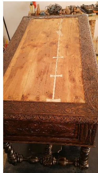
Foto 33. Consolidarea blatului și fixarea în pene tip coadă de rândunică.