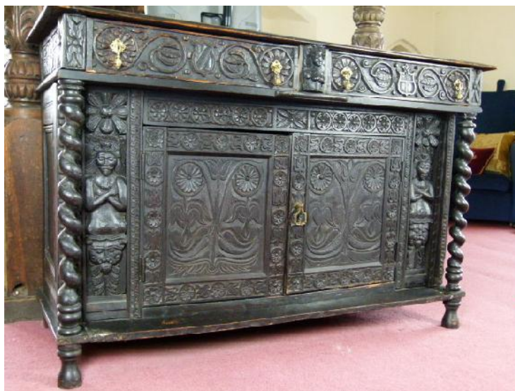
Foto 6. Imagine analog pentru identificarea elementelor decorative.

Stilul Jacobean este recunoscut pentru aspectul tridimensional al decorațiilor. Lemnul este adânc sculptat iar elementele care ies în evidență (picioare de masă, scaun) erau accentuate.