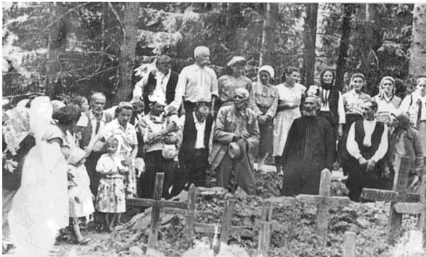
Strămutarea cimitirului, unul dintre cele mai dureroase momente trăite de hangani (1959)