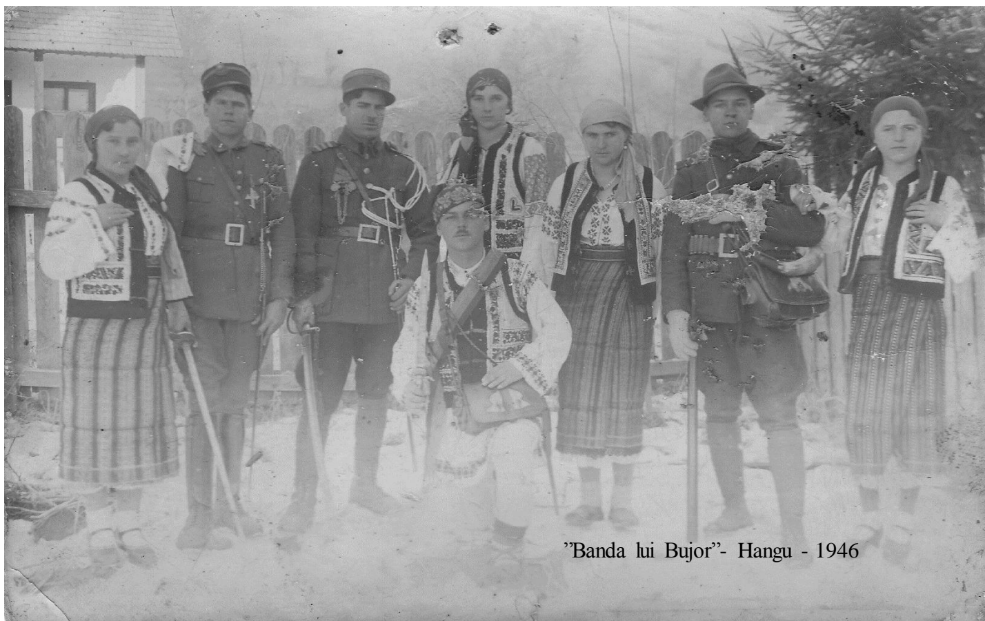
'Banda lui Bujor'- Hangu - 1946