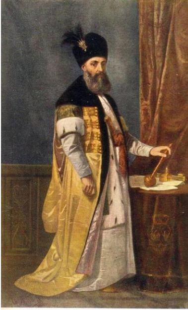
GRIGORE al II-lea GHİKA VODĂ 1600 – 1752

lor ca un act de dreptate dumnezeiască, pentru că au fost niște oameni drepecți „ Singur Dumnezeu, preste nădejdea omenească ferește pe cei direpecți de primejdii, că ce oameni au fostu acești doi, aicea în țara aceasta, ales lordachie vistiernicul, fără de scrisoarea mea credzu că va trăi numele lor în veci într-această țară de pomenirea oamenilor, den omu în omu. ”