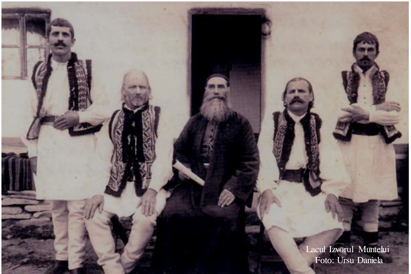
Lacul Izvorul Muntelui