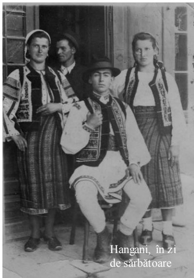
Hangani, în zi de sărbătoare