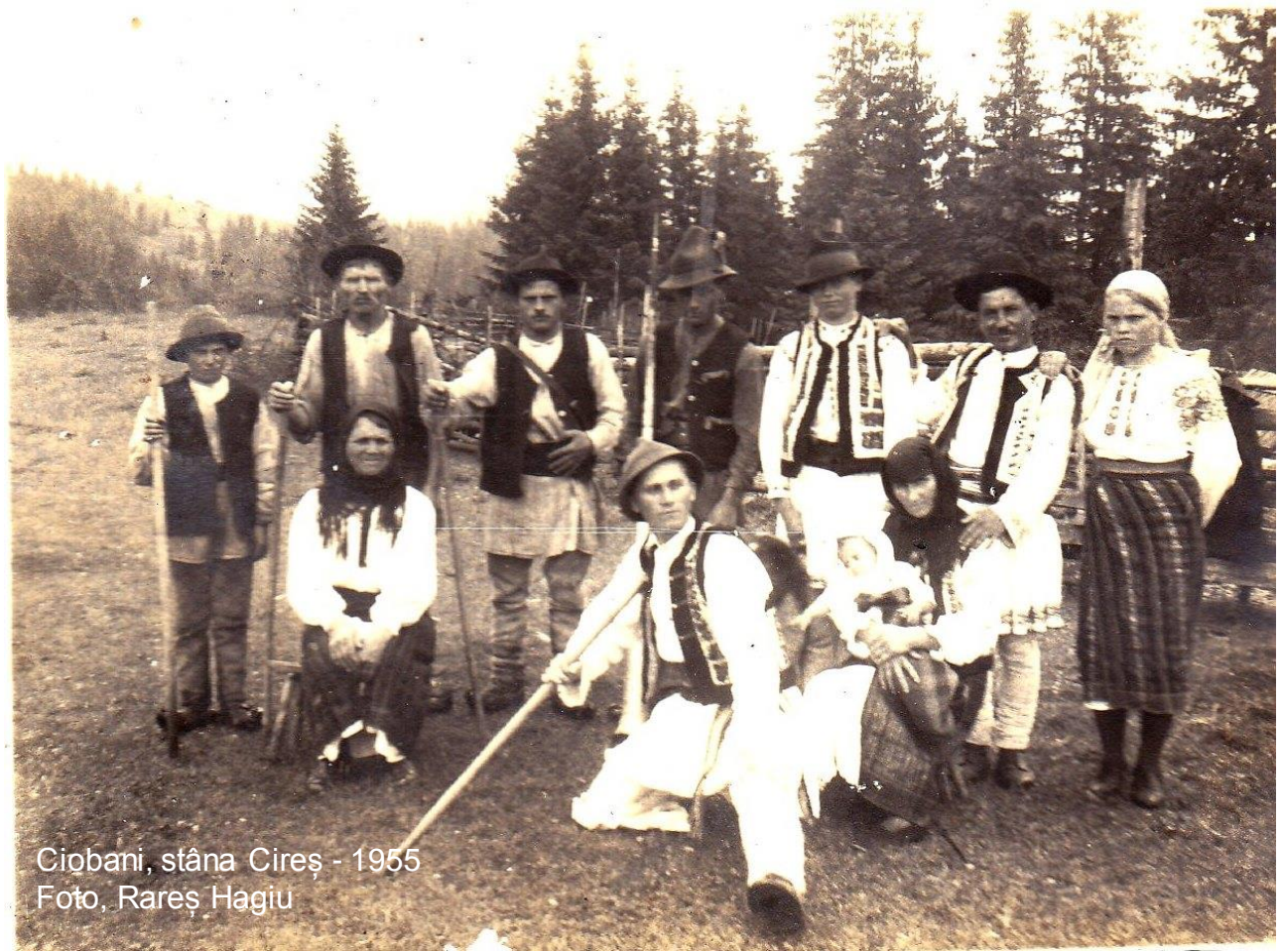
Ciobani, stâna Cireș - 1955