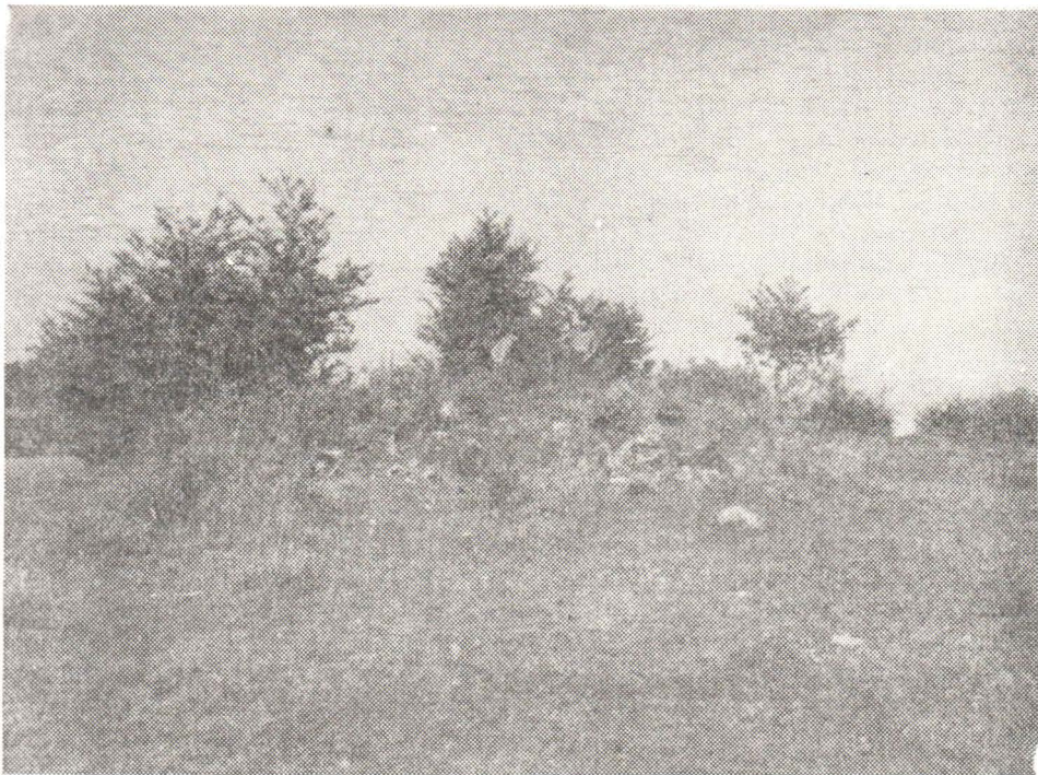
Fig. 3. — Ruinele turnului mare roman de pe „Ponița“.

În ceea ce privește „construcția de piatră“, cu un plan circular, despre care se afirmă că ar fi fost o „fântină“ a cetății, fiind astupată ulterior, nu ne putem pronunța mai precis pînă la executarea unor sondaje arheologice.