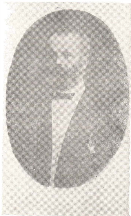
Fig. 2. — Florian Porcius, membru al Academiei Române, botanist, vicecăpitan al Districtului Năsăud. (Arh. St. Năsăud, Colecția de fotografii, V/197).

Activitatea desfășurată în districtul Năsăudului de-a lungul unui deceniu și jumătate, cît a existat această unitate administrativă a fost deosebit de fructuoasă. Din punct de vedere gospodăresc, administrația districtuală a reparat drumurile, a construit poduri, s-a îngrijit de buna funcționare a școlilor. A format cadre administrative românești creindu-se totodată condiții bune pentru educația politică a țărănimii prin exercitarea de aceasta a drepturilor politice acordate în cadrul administrației districtuale, limitate de sigur la concepția vremii (fig. 2).