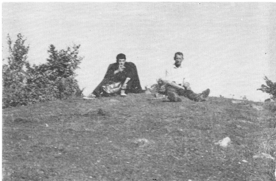
Fig. 3. — Ruinele unui turn sigur de pe dealul „Păltiniș” situat la vest de cătunul „Cireș” al satului Perișor (com. Zagra).

cît știm, nimeni nu a făcut vreo apreciere. Nici noi nu ne gîndim, momentan, la așa ceva. Credem însă că este de ajuns să amintim că marea majoritate a cercetătorilor care s-au ocupat de această chestiune, localizează în Maramureș tribul războinic, puternic, al costobocilor.