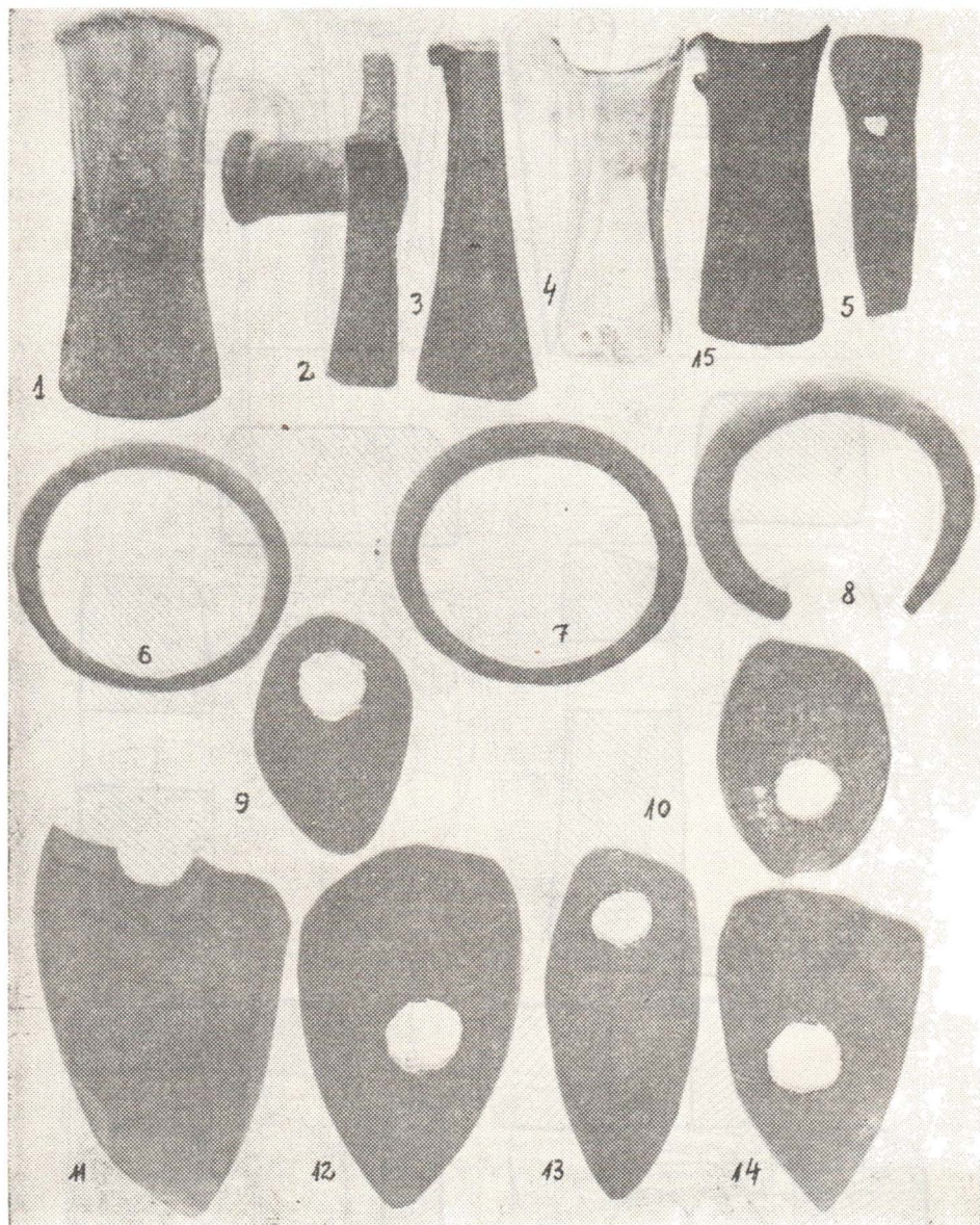
Pl. III. — Obiecte de piatră, bronz și aramă descoperite la : 1—4, 5—13, Căianu Mic ; 14, Căianu Mare ; 15, Ciceu-Poieni. (foto). 1/2.