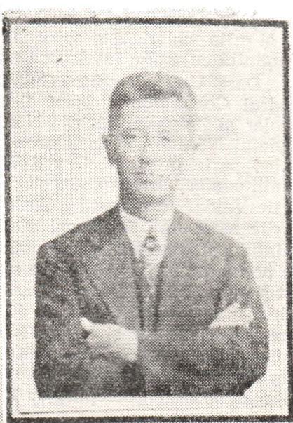
... la Bistrița (1930)