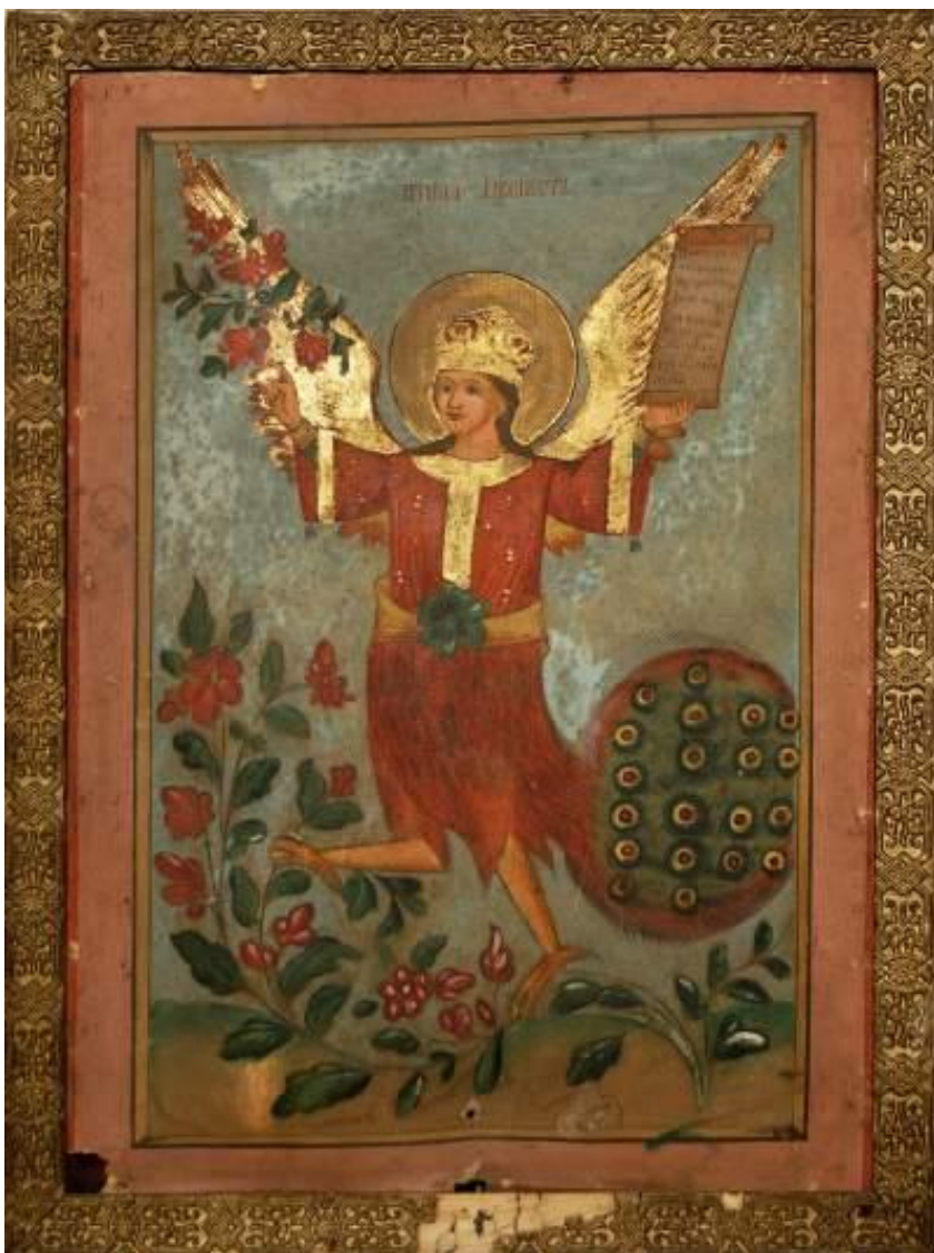
Fig. 1 Tablou – Pasărea Alkonost din casa Jurilovca (față), Muzeul Satului.