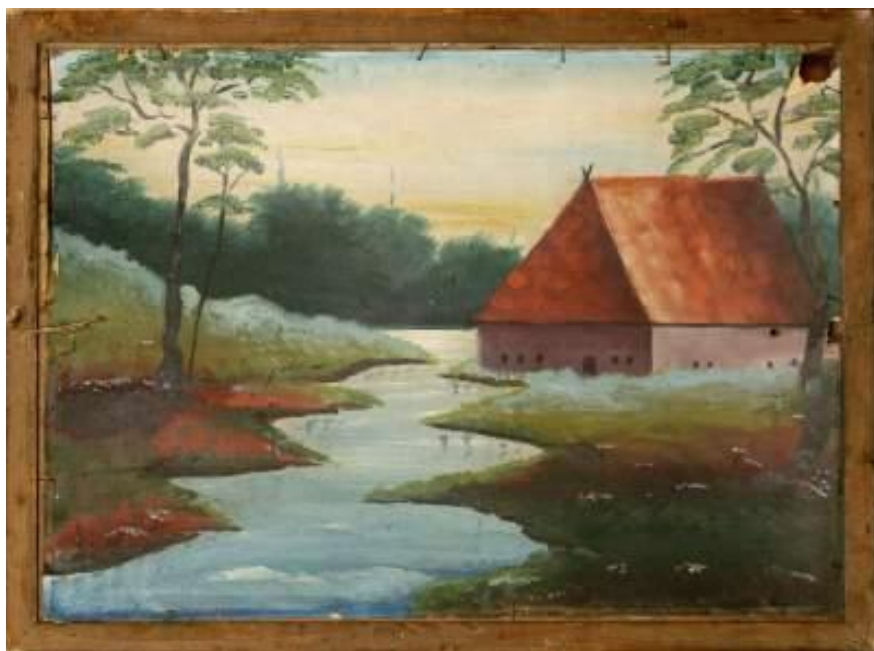
Fig. 2 Același tablou pictat pe verso.