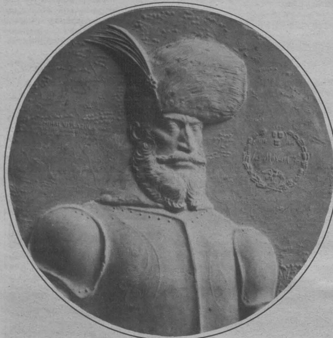
Gheorghe ADOC: Mihai Viteazul

- E un cătun pus pe cel mai fâlos grind din bălți, un grind în formă de potcovă, care adăpostește un golf mereu rîvnit de liște, călifar, nagli, giște. Acolo-și aduce primăria Brăilei, la iernat, ștrandurile ei plutitoare. Dar popa Ivanov păstrează din cătunul ăla numai amintiri botoase! O dată, pe cînd umbra cu botezul, l-a fugărit taurul