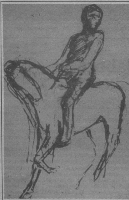
Paul VALÉRY: "Cavalier"