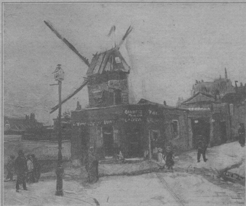
Le Moulin de la Galette

să nu mai stingi lumina! în drumul spre Nirvana, ori numai spre o tristă re-ncarnare, să-nlocuiască mâna ce aprinde o flacăară în dreptul frunții tale