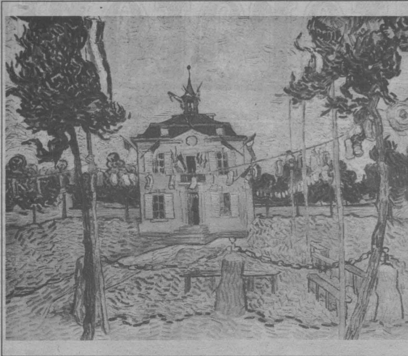
Primărie în Auvers