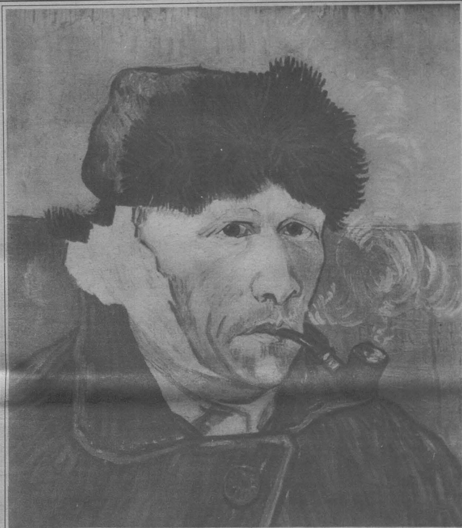
Omul cu pipă ( autoportret)

Ilustrăm acest număr cu lucrări de Vincent van Gogh