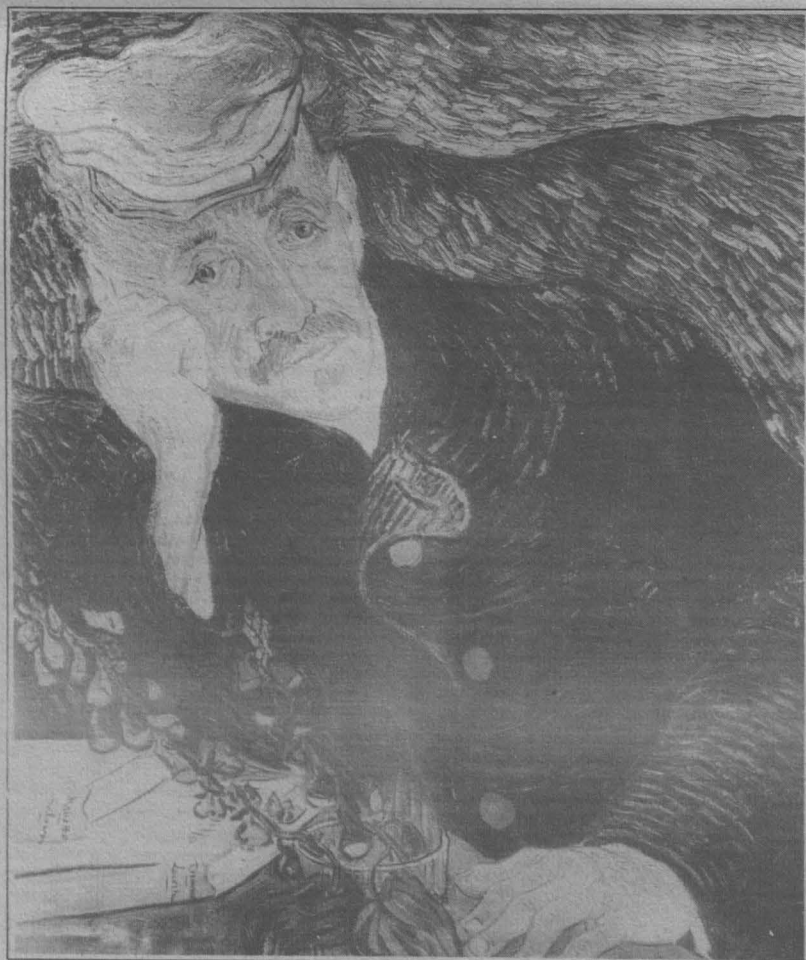
Portretul doctorului Gachet

Așteptăm al doilea volum al Istoriei literaturii române .