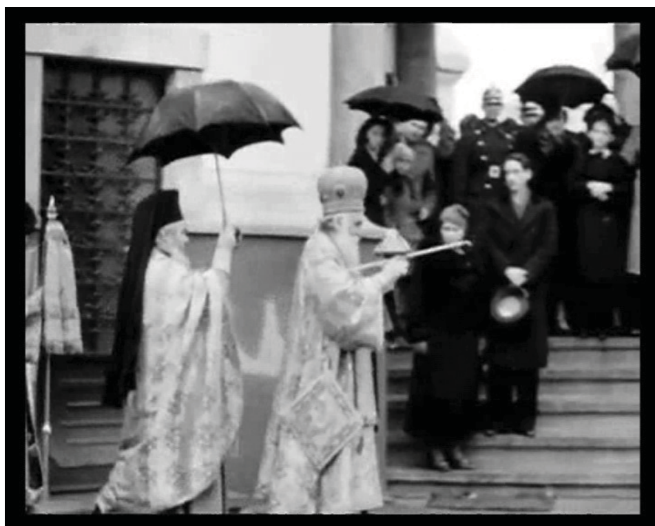
Imagini de la târnosirea Bisericii Sf. Apostoli, surprinse de Constantin Brâncuși cu aparatul de filmat.