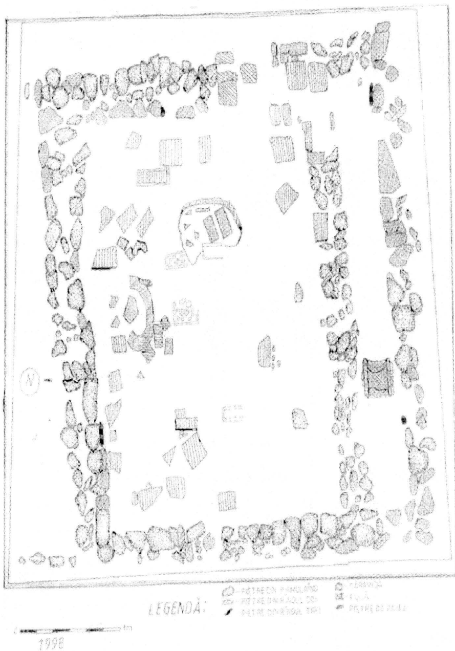
Fig. 1. Bumbești Jiu - "Vârtop" C 1 / 1998 planul săpăturii