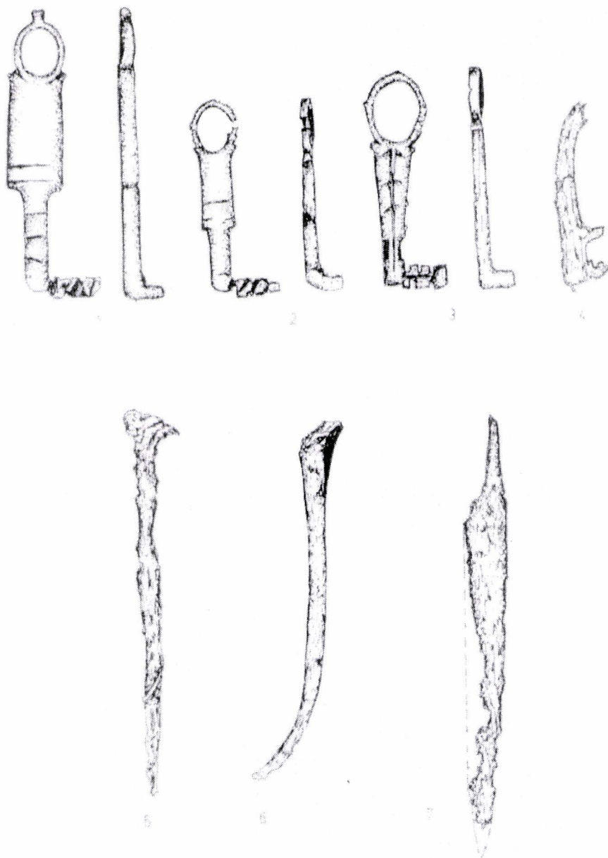
Planșa 2. Obiecte de metal din așezarea civilă romană de la Bumbesti Jiu - "Vârtoș"; 1-3 chei din bronz; 4 cheie din fier; 5-6 cuie; 7 cuțit (1-7 scara 1:1)