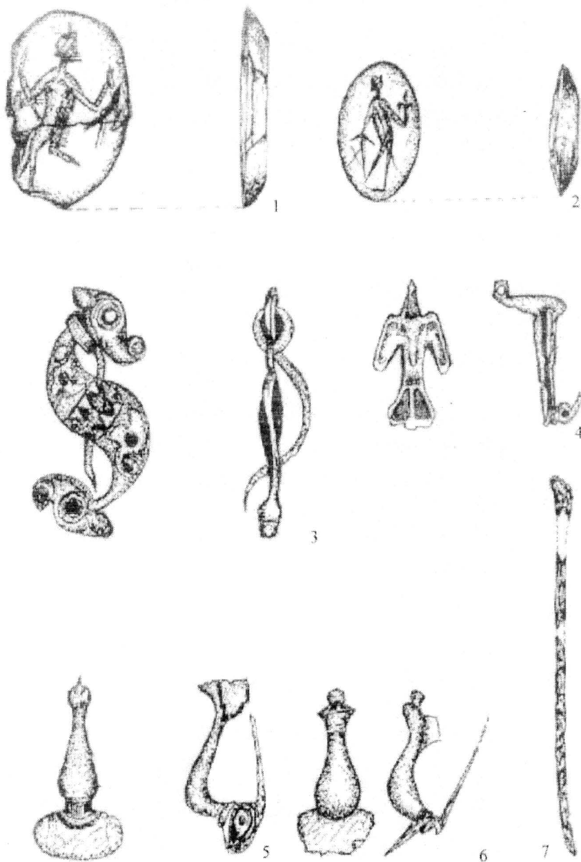
Planșa 1. Obiecte descoperite în așezarea civilă de la Bumbesti Jiu - "Vârtop"; 1,2 gema (scara 3X1); 3,4 fibule zoomorfe emailate; 5,6 fibule cu genunchi; 7 ac de bronz (3-7 scara 1:1)